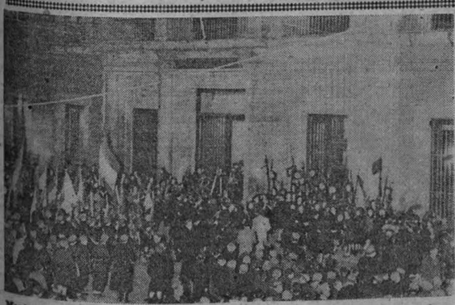
Manifestación de las extinguidas Organizaciones Juveniles ante el ministerio de Asuntos Exteriores, con motivo de la promulgación de la ley que crea el Frente de Juventudes.

Si eres falangista pon en tus cartas el sello "José Antonio".