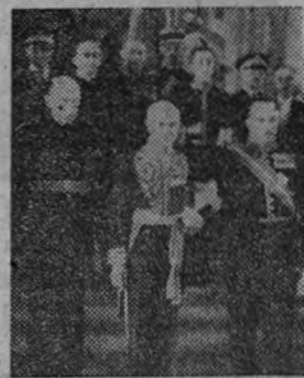
El embajador de Francia en el acto de presentación de las cartas credenciales al Caudillo.

Continuó recordando el generoso impulso del Caudillo, que le decidió a intervenir en el fin de la lucha y llamar a los combatientes a la razón. "Mirando el ejemplo—siguió diciendo—que da una España pacífica y restaurada gracias a V. E., y que ant-