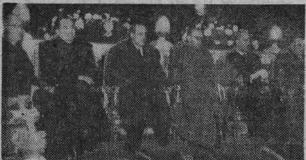
El Gobierno en la solemnidad religiosa celebrada en San Francisco el Grande con motivo de la festividad de la Patrona de Infantería.

En el cuartel del regimiento de Infantería número 2 se celebró una misa de campaña, y la tropa fue obsequiada con festivales en los cines Bilbao y Monumental Cinema.