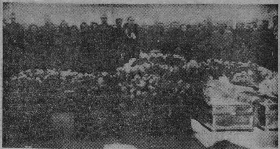
Los féretros de los camaradas que fueron asesinados en Paterna, alineados ante las tumbas en que reposarán, en el cementerio del Este.

Otras advertencias, podador: Ten en cuenta que las yemas de los sarmientos, conforme se distancian de la madera vieja —a excepción las empalizadas en los extremos— son más fértiles. Si quieres madera, poda corto. Si quieres uva, poda largo, pero sin extremar la nota en ningún caso. Cada cepa soporta bien un peso, un equilibrio, un determinado número de frutos. Rebাসando la carga, se la agota pronto. Un pie vigo-