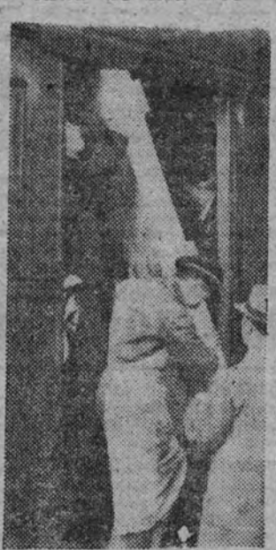
Momento de ser sacado del vagón, a su llegada a Madrid, el cuadro de la Inmaculada, de Murillo, devuelto por el Gobierno francés.

El domingo, a las tres de la tarde, llegó a Madrid la Inmaculada de Murillo, que es devuelta a España, y que se encontraba hasta ahora en el Museo del Louvre.