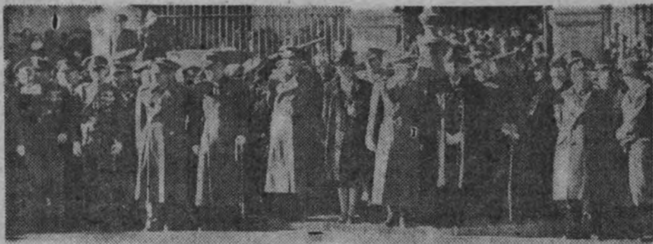
El Gobierno, autoridades e invitados, a la salida de la ceremonia religiosa, presenciando el desfile de las tropas.