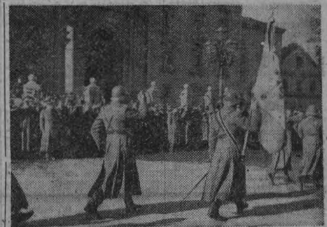
Fuerzas de Infantería desfilando ante el Gobierno y autoridades con motivo de la festividad de la Purísima.