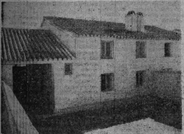
Una de las 51 viviendas protegidas, para braceros y labradores, que han sido entregadas por el subsecretario de Trabajo en Viso del Marqués.

En construcción la Escuela Nacional de Instructores en la Quinta de El Pardo, la Delegación Nacional de O. J. abre concurso para la construcción de su mobiliario con arreglo a las condiciones que se encuentran a disposición de los concursantes en su domicilio, Marqués del Riscal, número 16, hasta el día 20 del corriente.