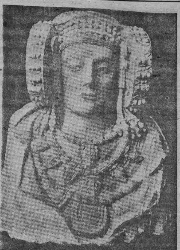
"La Dama de Elche" (Alicante). Piedra. Siglo V antes de Jesucristo. Procedente del Museo del Louvre, de París, vuelve a España.

Una cosa, empero, es cubile- tear y otra beber como Dios manda. En este punto el noble escritor cede sin ceder y se atene a la hora de la verdad a la bodega de su casa. Con- vengamos, así y todo, que al elaborar mixturas del espíritu de licor no estorba. En los hogares portugueses con abolengo las señoras dominan el arte, en ex- tremo difícil, de azucarar el café. A una le hemos oído nos- otros esta frase, que es perfec- ta: "La fiebre se mide por dé- cimas; tal cual veneno, por cen- tésimas; el, endulzado del café, por milésimas". El libro, por lo demás, es muy atrayente, curioso y útil para los aficionados al "cock-tail".