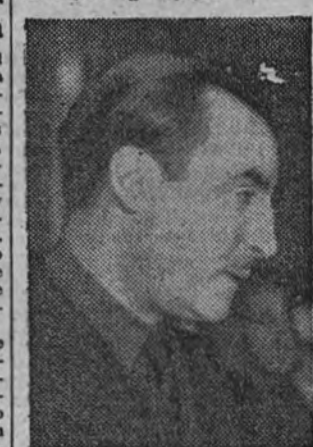
El camarada Miguel Primo de Rivera es felicitado por los concurrentes al acto.

El camarada Miguel Primo de Rivera pronunciando su discurso en el acto de la toma de posesión del Gobierno Civil de Madrid.