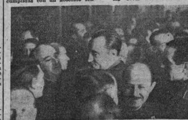
El camarada Miguel Primo de Rivera es felicitado por los concurrentes al acto.