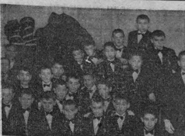
Los niños del Colegio de San Ildefonso, que cantaron los números y los premios en el sorteo de Navidad.