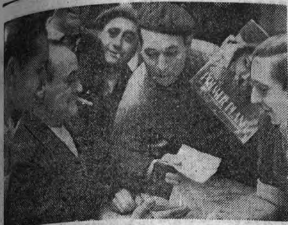
Algunos no se conforman. Este obrero del cierre de Gráficas Españolas está diciendo con un dejo de tristeza: "Si yo lo hubiera sabido..."