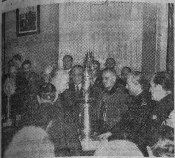
El ministro de Asuntos Exteriores, Sr. Serrano Suñer, y el obispo de Madrid-Alcalá, en el acto de entrega de las imágenes de la Virgen del Pilar que serán entronizadas en los establecimientos bancarios.