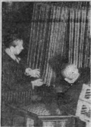
Recuento de bolas momentos antes del sorteo.