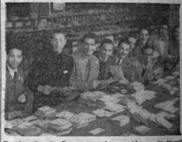
Funcionarios de Correos que han cogido un "pellizco" al tercer premio. Hoy habrá que perdonarles que la carta que habíamos depositado para Orense nos la envíen a Honolulu.

BARCELONA 21.—Se van conociendo nombres de agraciados con el segundo premio en las participaciones de una peseta repartidas por la perfumería Lido. Indistinto es decir la alegría que existe en la calle Mayor, de Gracia, pues en todo el contorno no ha quedado dependiente ni portera que no tuviera participaciones de 2,50; cuatro por Diego López, estancero, en participaciones de una peseta; dos lo han sido en participaciones