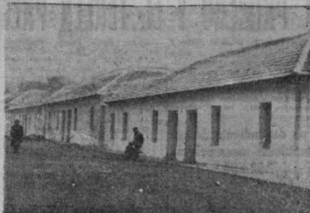
Viviendas construidas por Auxilio Social en Madrid, que serán entregadas a doscientas veinticinco familias necesitadas

La ley de Reforma tributaria contiene un precepto, en el que textualmente se afirma lo siguiente: "Quedan exentas de cualquier especie de investigación administrativa las cuentas corrientes acreedoras a la vista, de los clientes, que se lleven por Bancos, banqueros y Cajas de Ahorro."