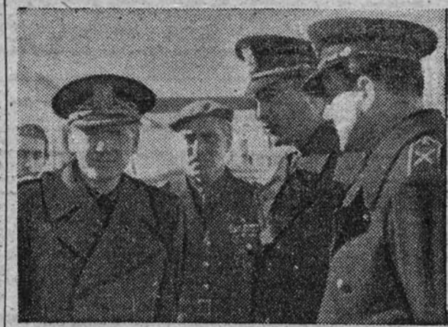
El presidente de la Junta Política, camarada Serrano Súñer, con el jefe provincial de Madrid y el delegado nacional de Auxilio Social, en el acto inaugural de los albergues construidos por Auxilio Social.

Al terminar el acto las fuerzas desfilaron ante las altas jerarquías y autoridades presentes.