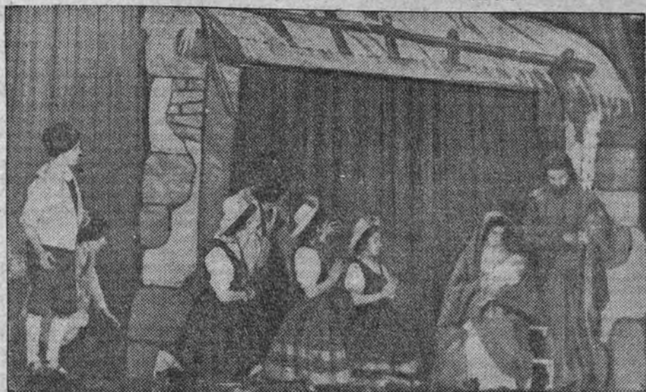
La Sección Femenina, en colaboración con el "Carro de la Farándula", organizó en el Palacio de la Música una función homenaje a los niños acogidos en las instituciones de Auxilio Social.—Una escena del Belén representado por el "Carro de la Farándula".