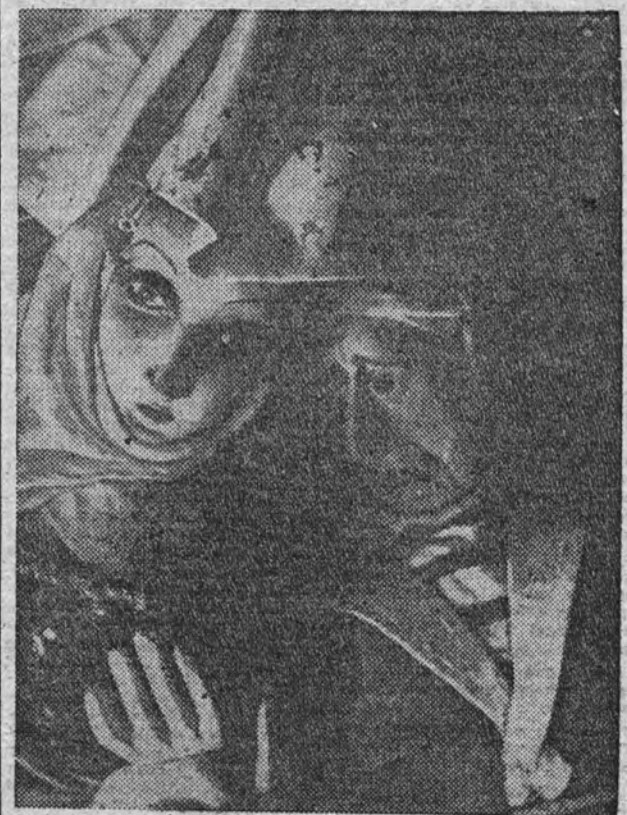
Escena de "El mancebo que casó con mujer brava", del conde de Lucanor. Extemplo 35.