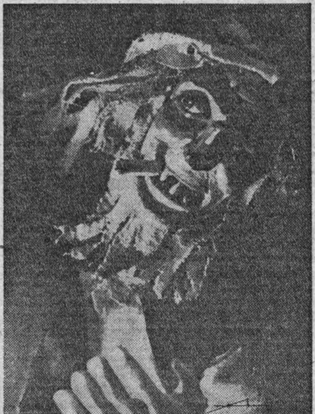
Tipo de mendigo, del teatro de marionetas del Retiro.

do el difícil manejo de los muñecos, hasta el punto de que, a pesar del poco tiempo que llevan de práctica, pueden competir en habilidad con los mejores operadores. Las exhibiciones que