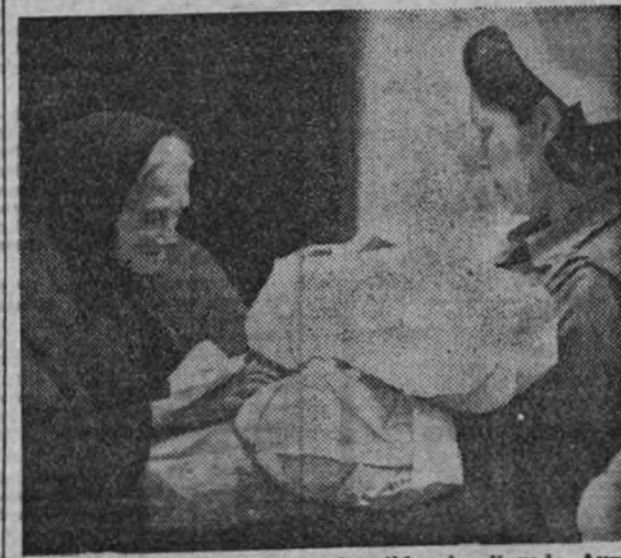
A las puertas de las casas humildes ha llegado Auxilio Social con sus donativos de Navidad, repartidos por las camaradas de la Obra.

El gran Nacimiento del Retiro adquiere en la noche mayor brillantez con su fantástica iluminación.