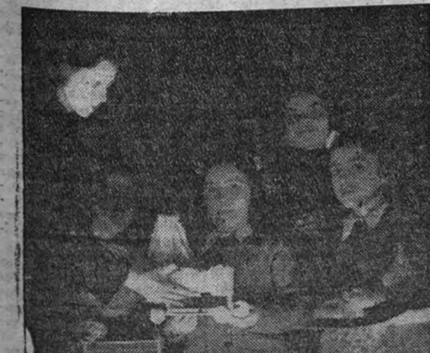
Después de la representación del "Nacimiento" se hizo un reparto de juguetes y el grabado recoge un momento de este acto.