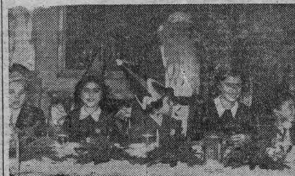
Carmencita Franco reunida con los niños acogidos por Auxilio Social, durante la fiesta celebrada en la Embajada del Brasil, donde los pequeños fueron obsequiados.

Fué servida a los niños una espléndida merienda, y la compañía infantil actuó entre la alegría de la menuda concurrencia. Luego "Melchor", "Gaspar" y "Baltasar" distribuyeron los juguetes junto al "Belén" y se oyeron las cornetas y tambores de los flechas y pelayos.