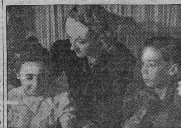
La esposa del embajador del Brasil conversa con los niños atendidos por Auxilio Social, a los que ha obsequiado en la fiesta de Navidad.