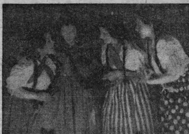
Una escena del "Nacimiento" en la que intervienen camaradas de la Sección Femenina.