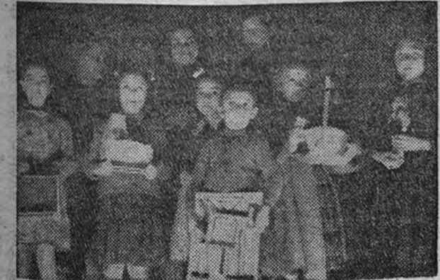
Un grupo de niños, después del reparto de juguetes, muestra su satisfacción por los que les han correspondido.