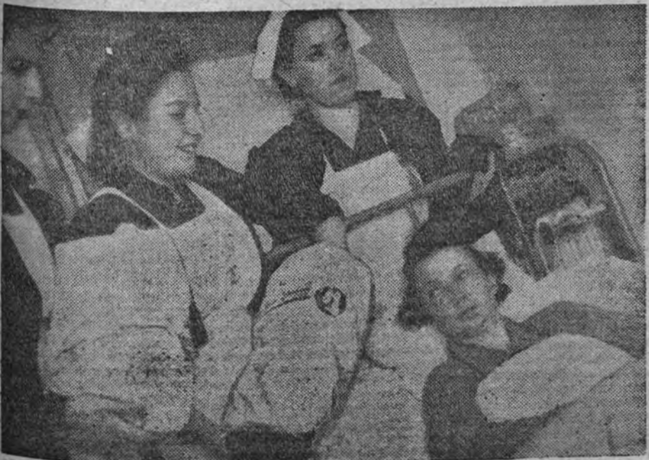
La Falange ha celebrado las Navidades con numerosos actos de hermandad, multiplicados en todos los lugares de España. Muchachas de Auxilio Social de Madrid, recorrieron los hospitales, donde entregaron regalos a los enfermos.

GRAN NACIMIENTO DEL RETIRO: Ilusión de los niños, admiración de los grandes.