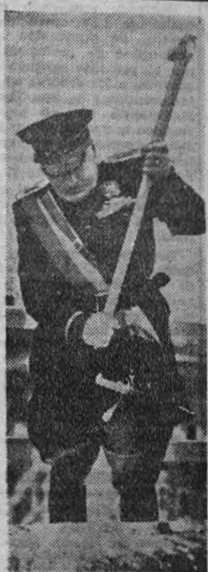
Benito Mussolini, creador del fascismo.

Sería de la más alta utilidad popularizar en España las bases ideológicas dadas por Mussolini al fascismo. España se encuentra en circunstancias muy parecidas a las de Italia. España es un país viejo, formado, juvenil, cuya aportación a la civilización y a la cultura humana ha tenido un volumen inmenso. A pesar de ello, España no ha tenido el rango que le correspondía en el concierto de los pueblos; pero lo va teniendo, y nuestra posición en el mundo, si se compara con la época inmediata, implica un mejoramiento indescriptible. Y vendrá mucho más, y será altamente sustancial; porque hacia muchos años, muchísimos, que España no dedicaba sus mejores energías a