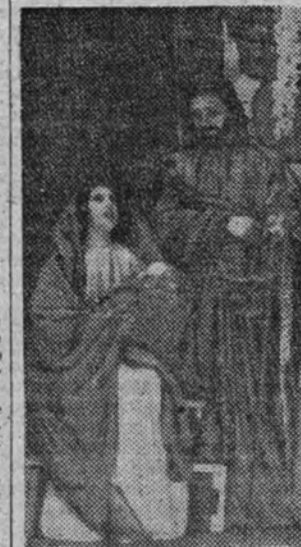
La Sagrada Familia del "Nacimiento" representado en el Palacio de la Música por el "Carro de la Farándula" con la cooperación de la Sección Femenina.