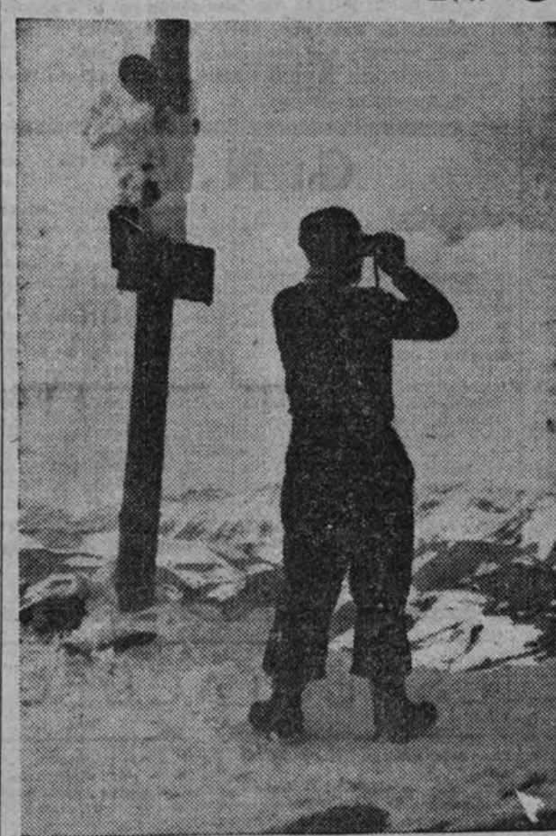
Las primeras nieves en las cumbres atraen ya a los deportistas de Europa.