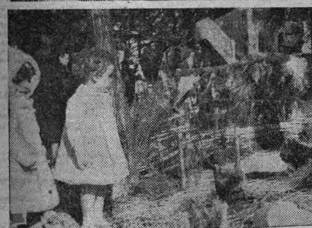
Los pequeños, discurriendo por entre las figuras del Nacimiento, muestran su admiración y contento al contemplarlas.

En un editorial de este mismo ARIBA—24 de diciembre de 1939—se nos recordó, con palabras de San Buenaventura, cómo "el tercer año antes de que el beato Francisco muriese, le dio la gana de hacer memoria del Nacimiento de Cristo, para mover la gente a devoción".