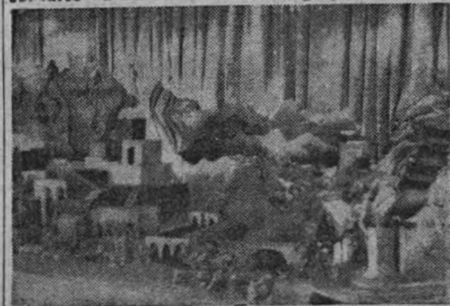
Uno de los más bellos Nacimientos es el instalado en el grupo escolar Palacio Valdés.