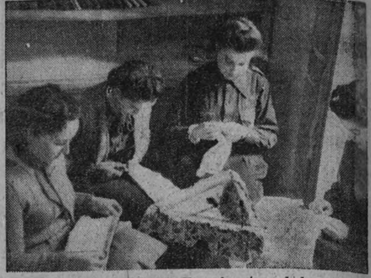
Hoy se efectuará en la Escuela Hogar la entrega de las cartillas y juguetes confeccionados por las alumnas que asisten al curso de dicho Centro. Camaradas de dicha Escuela trabajan en la terminación de las últimas prendas.

NEW YORK 2.—Desde Londres se comunica que las alarmas dadas en dicha capital durante el pasado año tuvieron una duración de mil ciento ochenta horas, o sea cuarenta y nueve días. El número de alarmas fue de 400, de las cuales casi todas fueron dadas en la segunda parte del año. (Efe.)