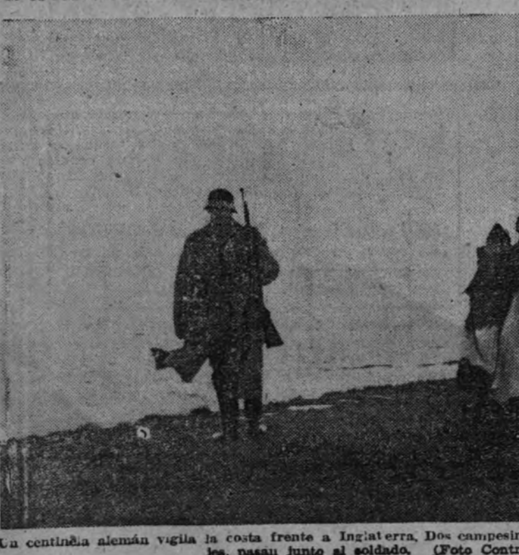
Una centinela alemana vigila la costa frente a Inglaterra. Dos campesinas holandesas, con sus típicos trajes, pasan junto al soldado.