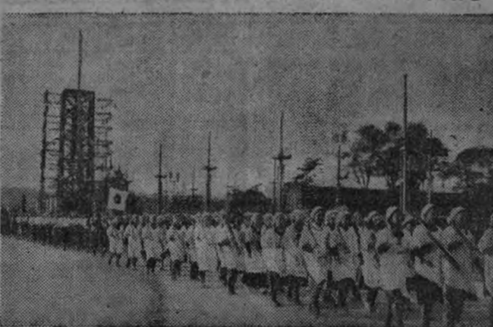
Muchachas japonesas del servicio voluntario encuadradas en la "Asociación de Mujeres de Tokio" desfilan durante las fiestas del 2.600 aniversario de la fundación del Imperio.