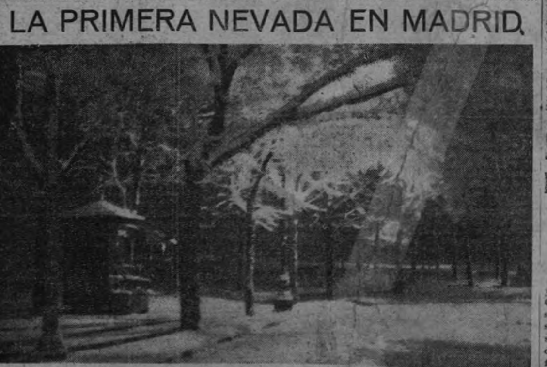
Bello aspecto que presentaba anoche, después de unas horas de nevada, este rincón del pascu del Prado, cercano a la plaza de Neptuno. (Foto Contreras.)

VICHY 1.—El "Diario Oficial" ha publicado hoy el decreto en virtud del cual los generales De Gaulle y Catroux quedan desposeídos de la nacionalidad francesa y, en su consecuencia, de todas sus condecoraciones y de su graduación militar. Estas medidas fueron acordadas, como se recordará, por el Consejo de ministros hace algún tiempo. (Efe.)