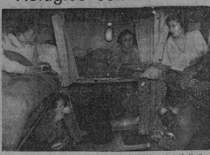
Mientras llegan o no llegan los aviones yanquis, estas "ladices" se han preparado un refugio confortable. Cigarrillos y buen té, mientras los "Stukas" llenan de incendios y de ruinas la capital del primer Imperio del mundo.