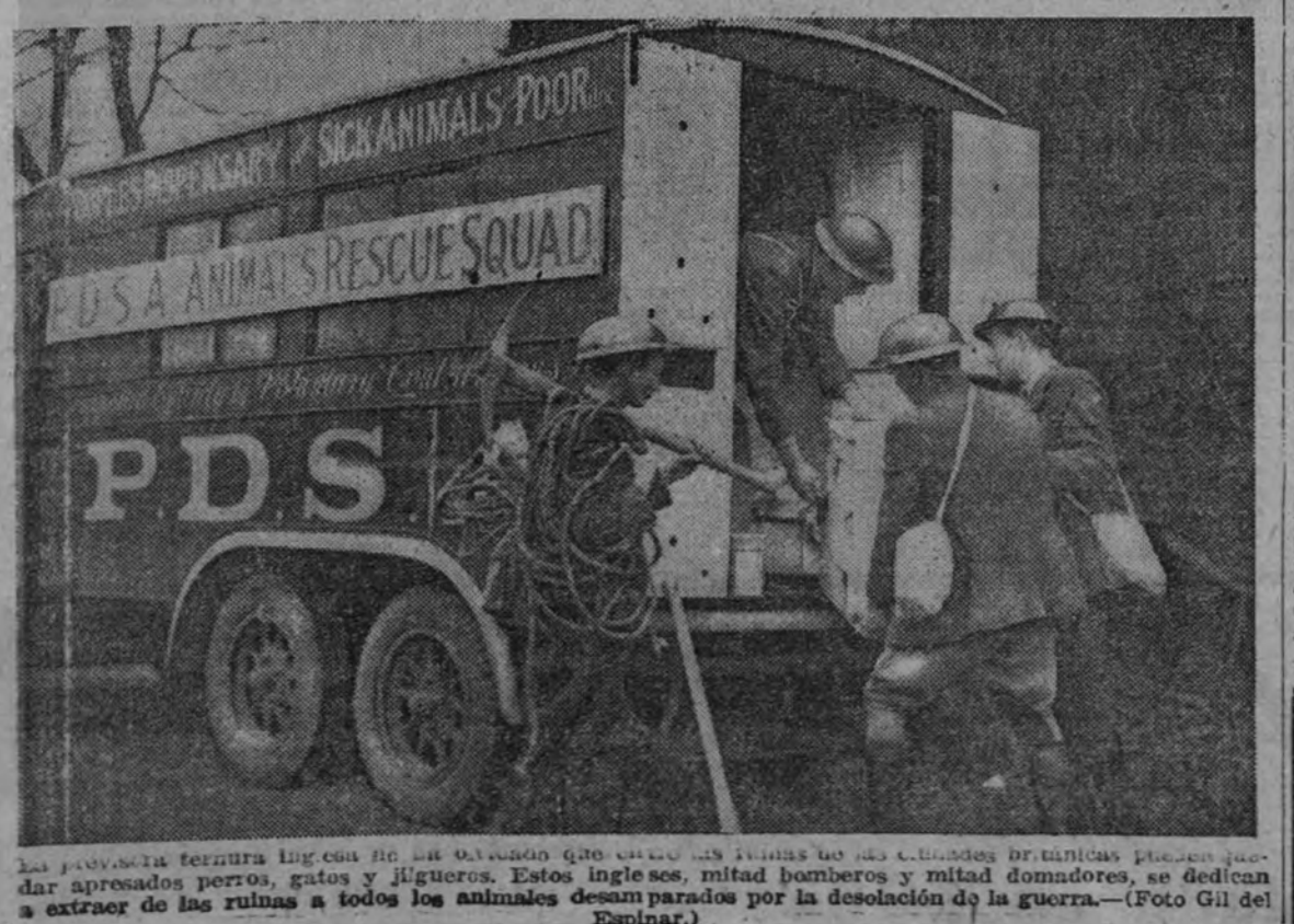
La provincia de Murcia ha sido atacada por los submarinos británicos, que han aprehendido perros, gatos y jirafas. Estos animales, mitad bombas y mitad guerras, se dedican a extraer de las ruinas a todos los animales desamparados por la desolación de la guerra.