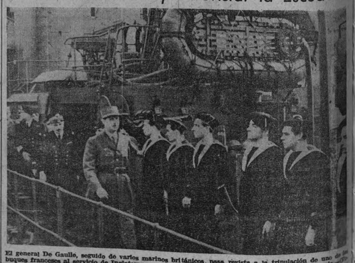
El general De Gaulle, seguido de varios marinos británicos, pasa revista a la tripulación de uno de los buques franceses al servicio de Inglaterra que tomaron parte en el ataque a las colonias de Francia.