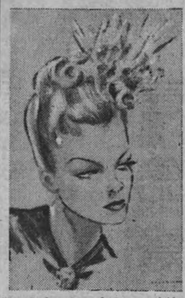
Una de las obras de la exposición de Baldrich.

El retorno de Baldrich nos hace pensar sin nostalgia en la generación actual presente de dibujantes que durante bastantes años ilustraron nuestros libros y revistas, y de cuya actividad puede ser considerado como el último representante. La obra de Baldrich, cuyo motivo melancólico era a su vez la habilidad técnica, corresponde a un momento en el que perdura nuestra inadecuación estética, si bien remonta con decoro la vulgaridad, encantadora por su ingenuidad y gracia retrospectiva, de aquellas ilustraciones anecdóticas y románticas de fin de siglo. Hay nos parece todo ello algo marcadamente lejano.