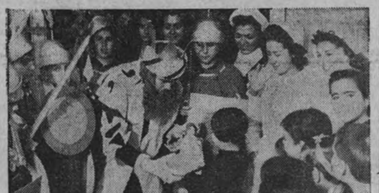
Una cabalgata organizada por el Frente de Juventudes recorrió ayer distintos centros infantiles repartiendo juguetes.