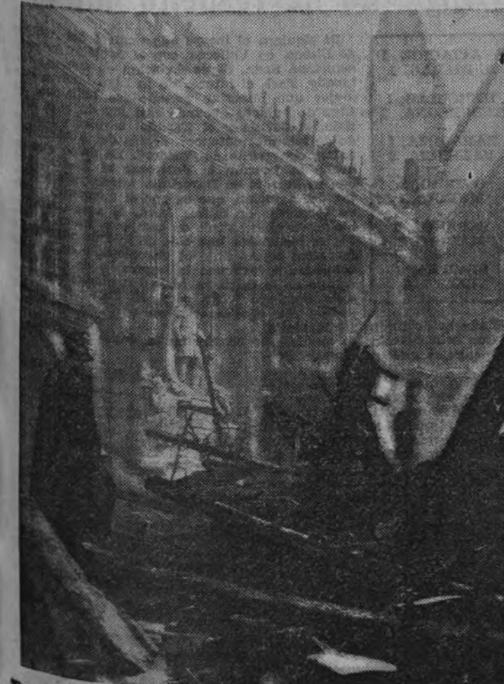
Durante uno de los recientes bombardeos alemanes sobre Londres, uno de los patios de la Casa Consistorial resultó alcanzado por una bomba