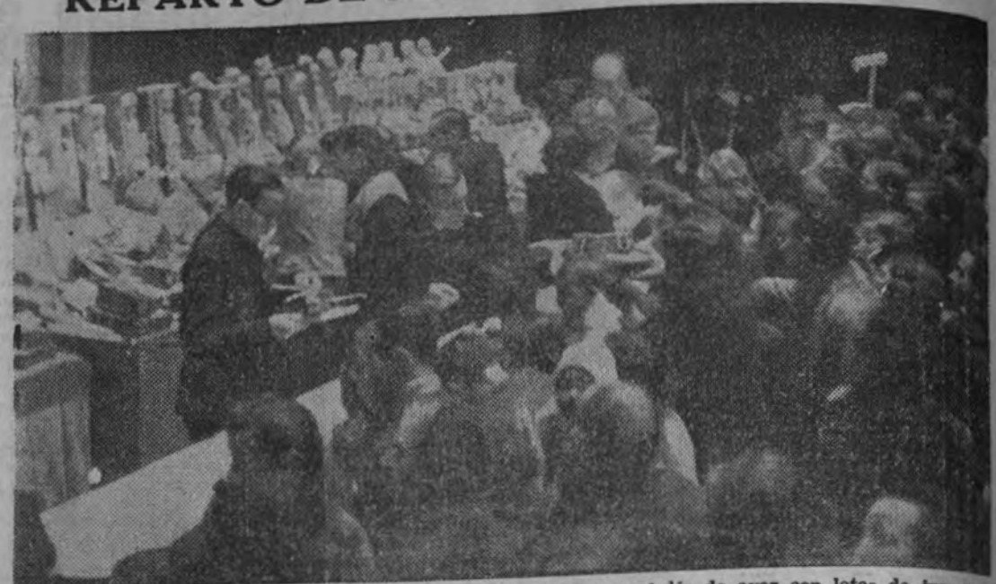
Los hijos de cuantos trabajan en ARRIBA fueron obsequiados en el día de ayer con lotes de juguetes.