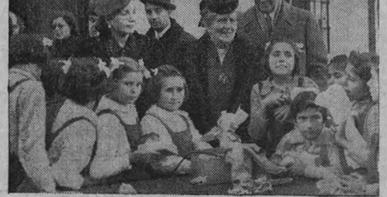
La embajadora de los Estados Unidos repartió juguetes a las niñas de la Escuela Hogar del pueblo de Vallecas.