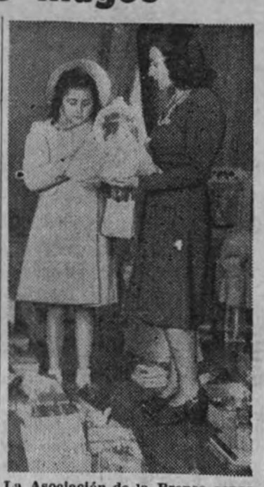
La Asociación de la Prensa repartió 45.000 pesetas de juguetes.

El Sindicato Local de Espectáculos ha enviado un programa completo, los Hermanos Díaz, cine músicos del Circo Price; el conjunto musical Rivera y sus hijos, que han hecho las delicias de todos.