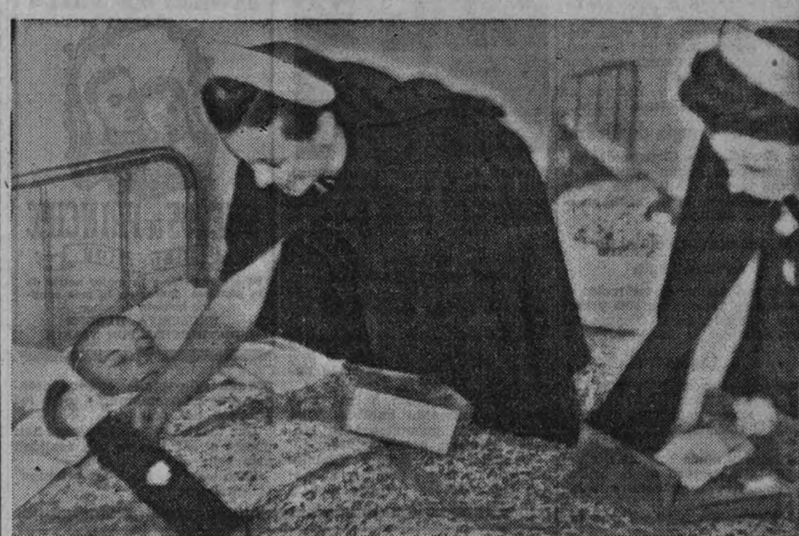
Los niños que en la noche del domingo fueron recogidos por el servicio correspondiente de Auxilio Social, recibieron también el regalo de los Reyes Magos.

Si eres falangista pon en tus cartas el sello "José Antonio".