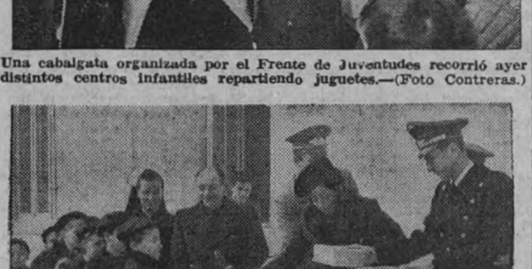
La embajadora de Alemania hizo un importante donativo de juguetes a los hogares infantiles de Auxilio Social, que fué entregado por representantes de la Embajada.