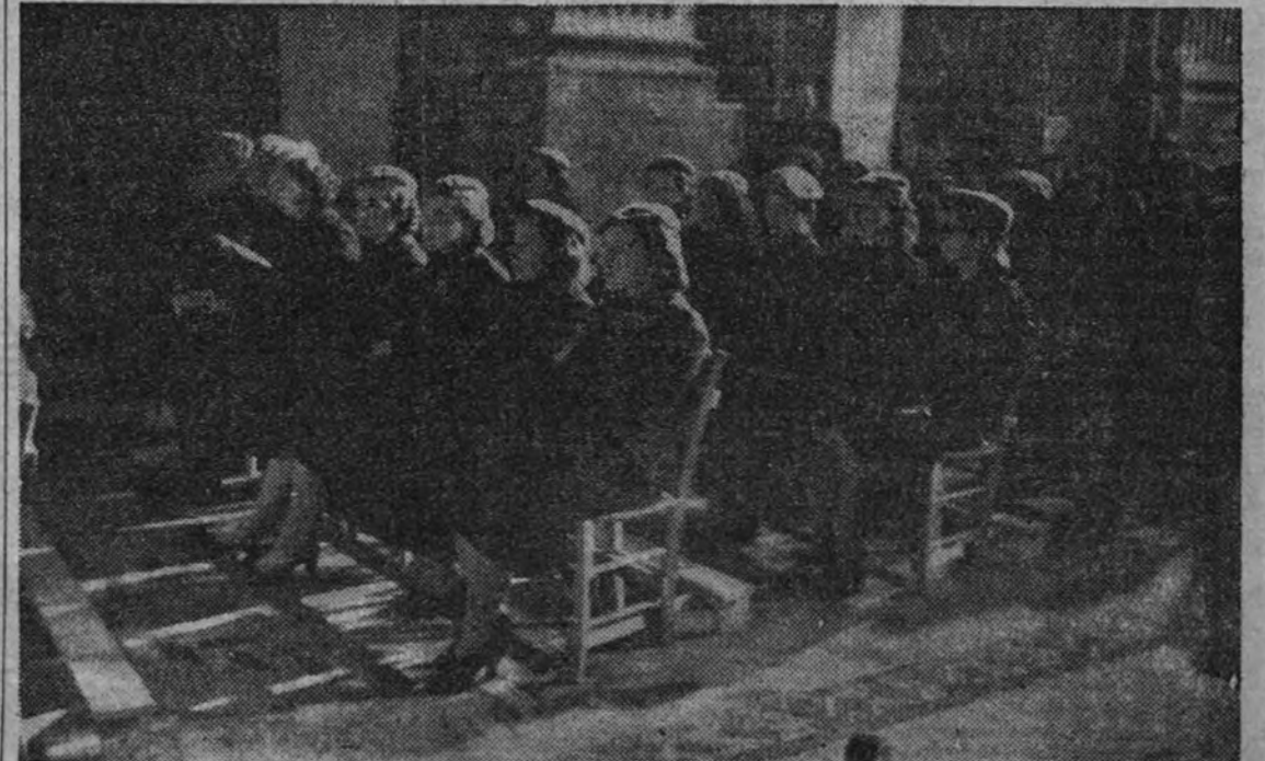
Comaradas de las distintas provincias españolas oyendo la misa en el templo de la Merced.