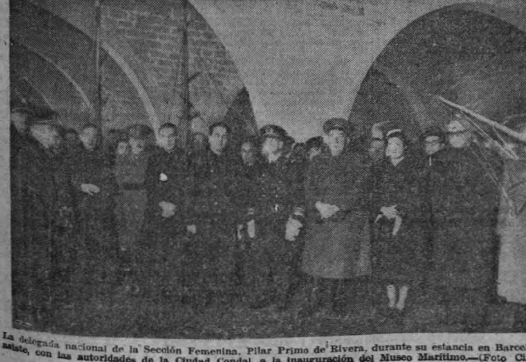
La delegada nacional de la Sección Femenina, Pilar Primo de Rivera, durante su estancia en Barcelona, asistió, con las autoridades de la Ciudad Condal, a la inauguración del Museo Marítimo.