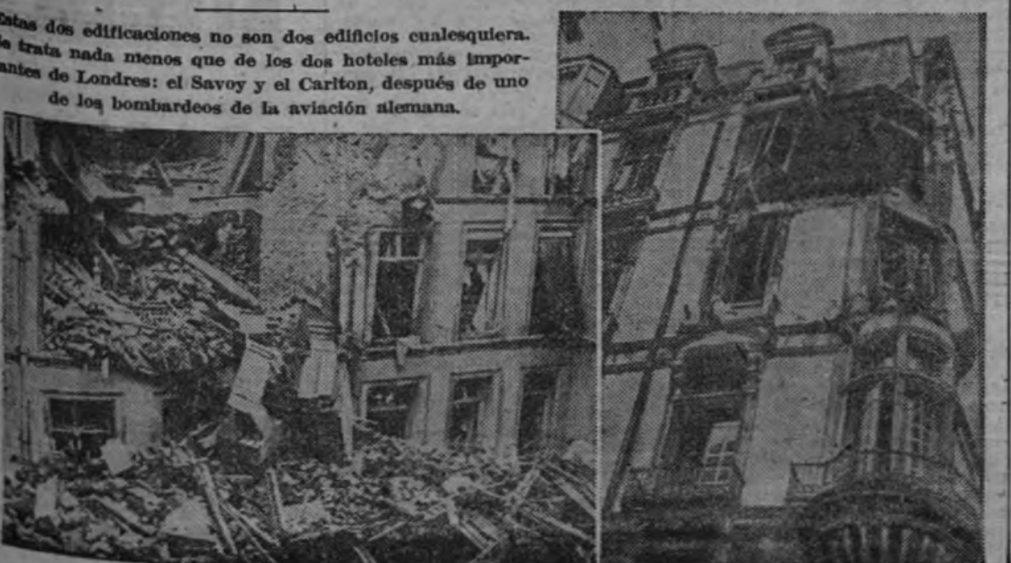
Estas dos edificaciones no son dos edificios cualesquiera. Se trata nada menos que de los dos hoteles más importantes de Londres: el Savoy y el Carlton, después de uno de los bombardeos de la aviación alemana.