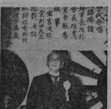
Chuji Machida, político japonés

TOKIO 22.—Según los círculos oficiales japoneses, el nuevo Parlamento deberá conceder al Gobierno poderes más amplios para que pueda hacer frente a la situación actual y adoptar las medidas que aconseje la defensa nacional. Entre otras cosas, se pide la movilización general. La opinión general en dichos centros es que próximamente se presentará un proyecto de ley que abarcará ambos extremos: la movilización y los plenos poderes. MACHIDA PIDE EL REFUERZO DE LA POTENCIA MILITAR DEL JAPON