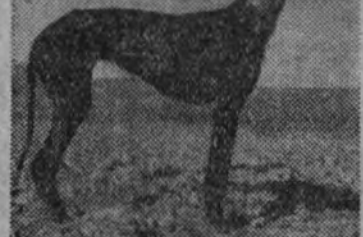
"La Parrala", campeón de Madrid.

El campeonato de España de galgos de campo se disputará en Salamanca. Tomarán parte doce galgos representando a seis provincias: 1. "Bonita III", campeón de Toledo; 2. "Navarro", campeón de Salamanca; 3. "Flecha III", campeón de Córdoba; 4. "Poeta II", subcampeón de Sevilla; 5. "Lola", subcampeón de Córdoba; 6. "Lancha", campeón de Cádiz; 7. "Toledano II", subcampeón de Madrid; 8. "Peluca", subcampeón de Cádiz; 9. "Bandera I", campeón de Sevilla; 10. "Conquista", subcampeón de Toledo; 11. "Bello II", campeón de Salamanca; y 12. "La Parrala", campeón de Madrid.