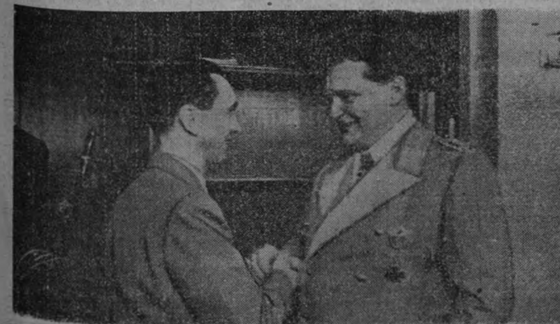
El doctor Goebbels felicita al mariscal del Reich, Herman Goering, con motivo de la fecha de su cumpleaños.