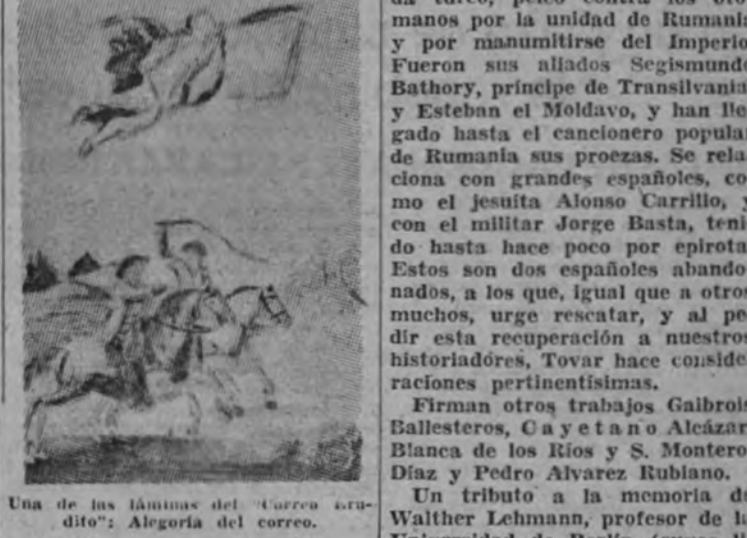
Una de las láminas del "Correo Erudito".

Tenemos delante cuatro entregas del "Correo Erudito", gaceta de las Letras y de las Artes. Las notas que esta revista, que en rigor no lo es, recoge, proceden del material que los investigadores van allegando en sus rebuscas y que no han de incorporar a la obra en que se emplean. Esos documentos que no se utilizan puros, sin embargo, esclarecen puntos críticos que otros investigadores estudian, y antes de que se dispersen o se pierdan, "El Correo Erudito" los archiva en sus páginas.