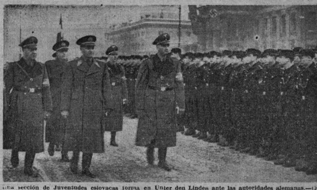
Una sección de Juventudes eslovacas forma en Unter den Linden ante las autoridades alemanas.