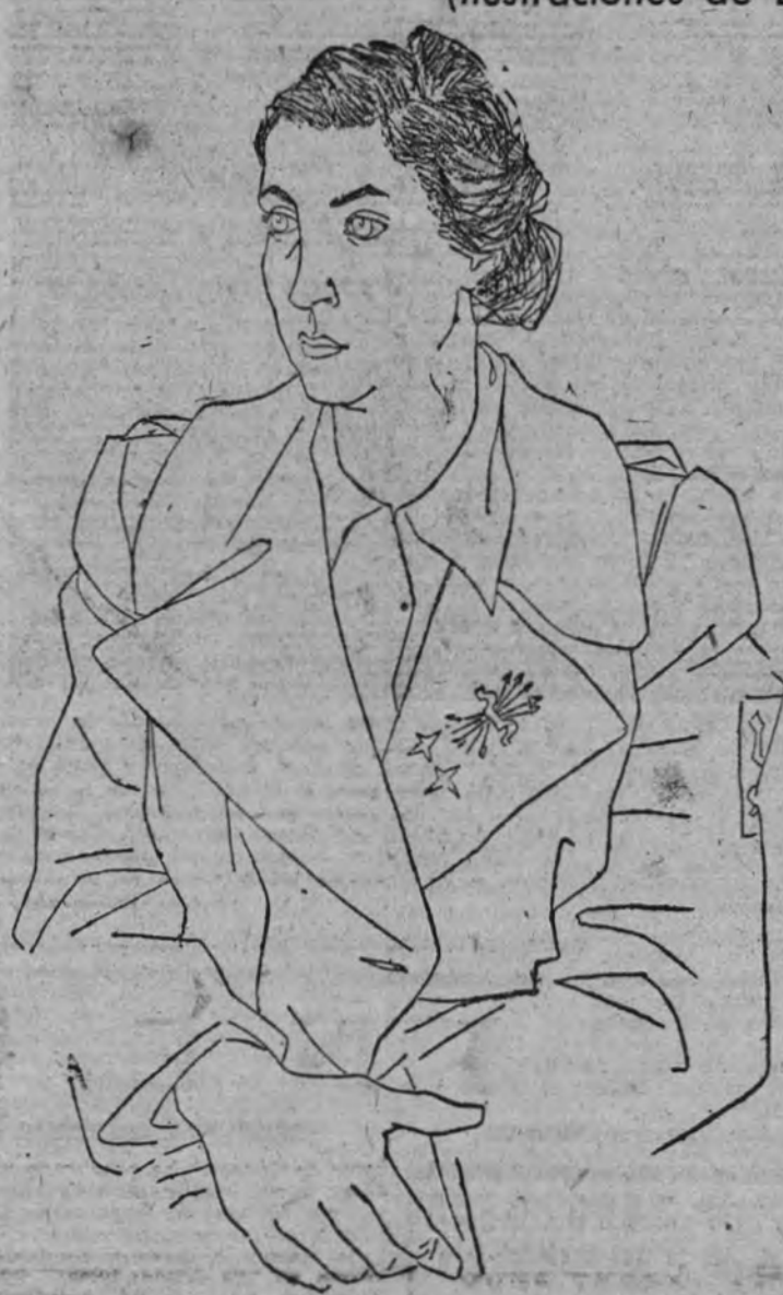
Pilar Primo de Rivera, delegada nacional

José Antonio, meta de los más limpios afanes, tiene un sitio de privilegio en la Sección Femenina. El está allí en todas las cosas. Su espíritu palpita en los más leves quehaceres y hasta casi se advierte su presencia física. Sus mejores retratos y sus palabras más bellas