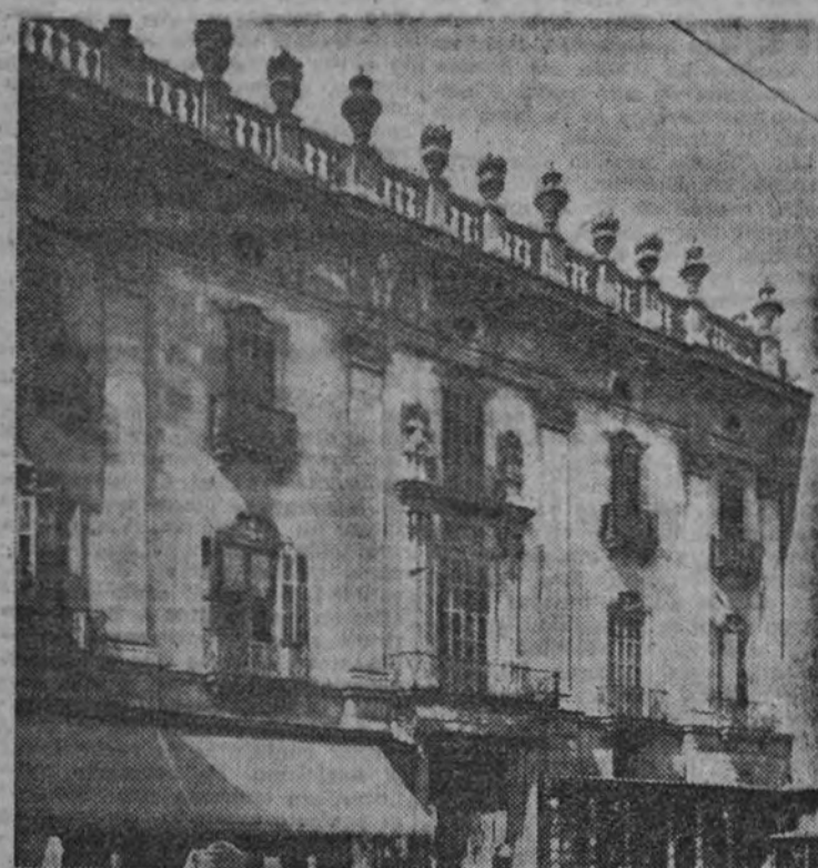
El Palacio de la Virreina, situado en la rambla de San José, de estilo barroco depurado, que ha sido declarado monumento nacional.

El hermoso edificio se ha restaurado por el Servicio de Defensa del Patrimonio Artístico Nacional