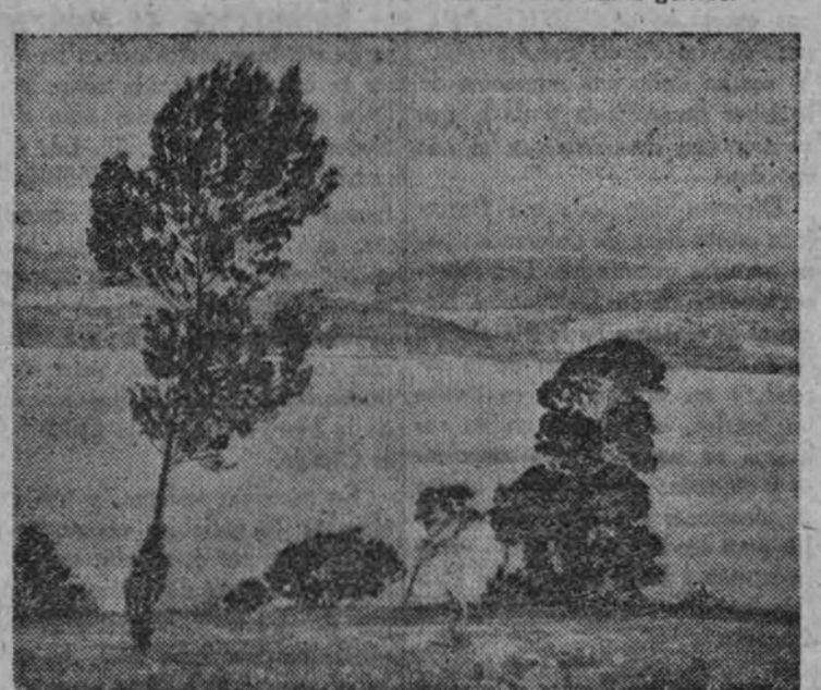
"Ria de Betanzos", paisaje de Llorens.

Este proceso espiritual que apuntamos alcanza además a los medios de expresión y a la forma. Así, la materia se ha hecho más ligera; el color, impregnado de frescura y fluidez, brota de los pinceladas en medio de una claridad desconocida en su arte; y aunque no ha ganado en profundidad de cubre en una síntesis una realidad colorista, delicada y poética. "Valle del Umiel", en plena madurez, no presenta aspectos de desconfianza, sino que la factura, en una plenitud verdadera, desmenua el