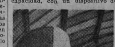
En la cola del velero "Kranich", que posee el "record" mundial de altura con 9.300 metros y una duración de vuelo de cincuenta horas, figuran los emblemas de la Falange.

de se encuentra instalada una milimétrica pero sugestiva salida de proyección. La reserva de películas muestra la atención con que se siguen en Alemania los procedimientos de enseñanza para el vuelo por medio del cine y la habilidad de los manejadores de las cámaras, a veces montadas en los mismos veleros, para plasmar en el celuloide las más audaces proyecciones de visión desde el suelo y desde el aire. No podía faltar en esta Exposición, dirigida rectamente al corazón y a la imaginación de las juventudes, el recuerdo de los caídos. Y allí están, en un "Presente" que los cineastas perpetúan, los bustos de José Antonio, Morán y Haya, fiel reflejo del espíritu que anima a los muchachos de la "Falange alada". Un mapa de España en relieve, con un sinnúmero de modelos de avión distribuidos por la piel de toro el número de campos de vuelos sin motor, que constituyen la aspiración organizadora y difusora de los que rigen los destinos del volevolismo nacional. Constituya dentro de la Exposición un conjunto técnicamente muy interesante el material de vuelo y de taller que Alemania ha donado, en espléndida manifestación de su cariño hacia España y nuestros jóvenes pilotos. El planeador escuela "S. G. 38" es el último modelo de su clase y tiene fama de dar un gran rendimiento. El velero escuela "Grunau Baby II B" es un monoplaza popularizado en Alemania. Está provisto de frenos aerodinámicos, y con él se han alcanzado alturas de 5.000 metros. En estos mo-