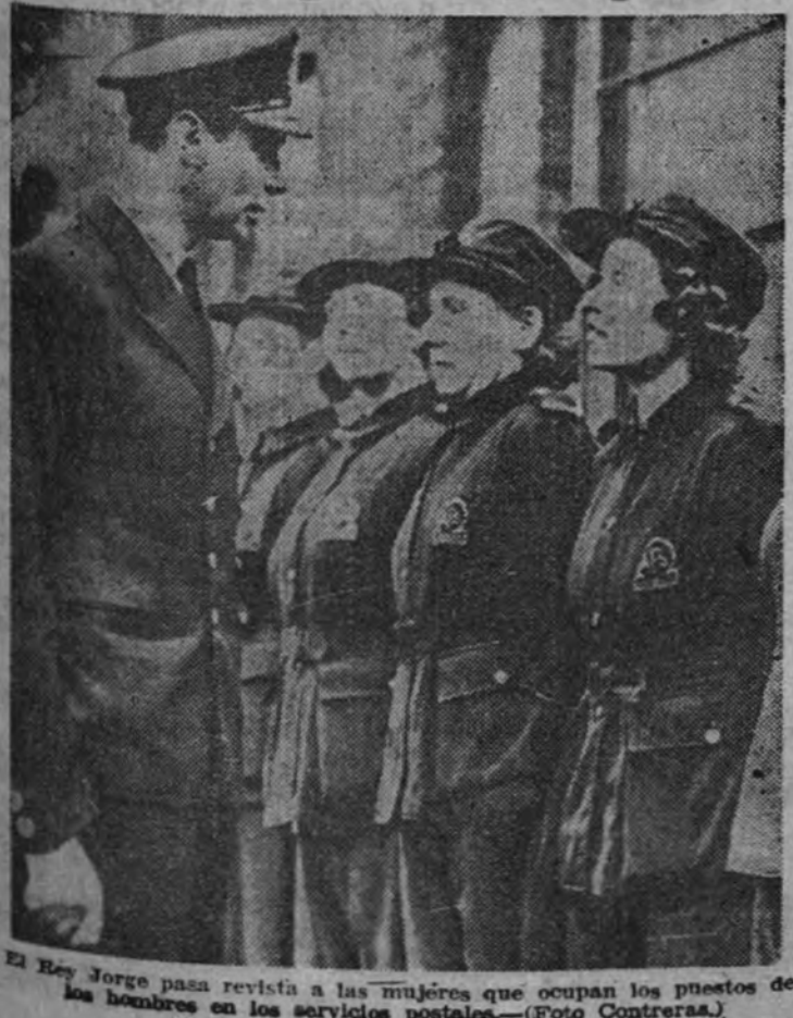
El Rey Jorge pasa revista a las mujeres que ocupan los puestos de los hombres en los servicios postales.