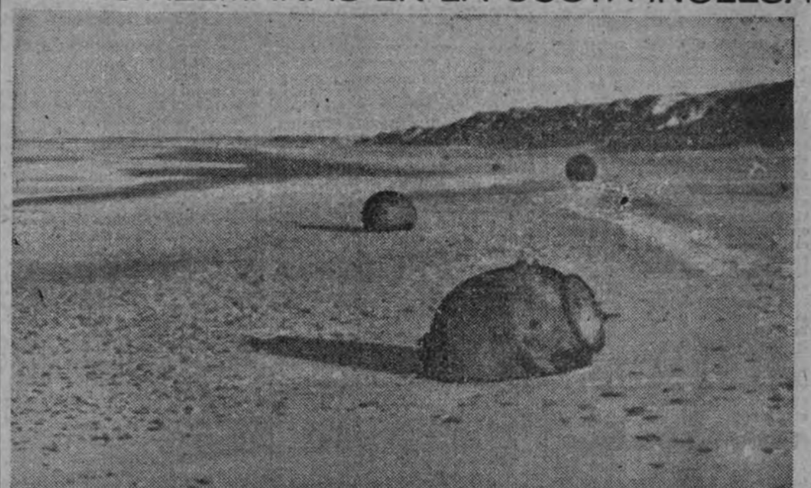
Las minas alemanas han sido arrojadas con tal profusión en las mareas enemigas que con gran frecuencia aparecen en las playas británicas, arrastradas por las altas mareas.