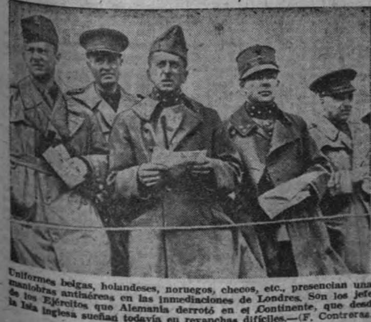
Uniformes belgas, holandeses, noruegos, checos, etc. presencian unas maniobras antiaéreas en las inmediaciones de Londres. Son los jefes de los Ejércitos que Alemania derrotó en el Continente, que desde la lista inglesa sueñan todavía en revanchas difíciles. (F. Contreras.)