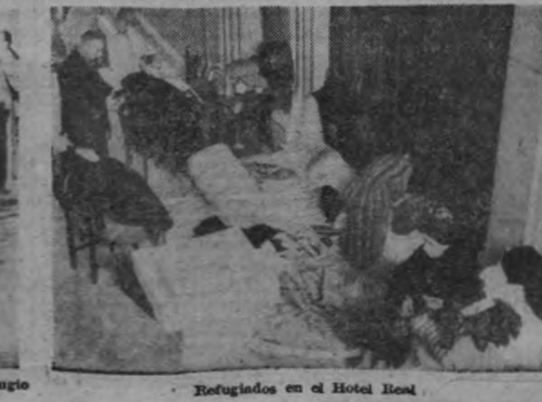
Refugiados en el Hotel Real