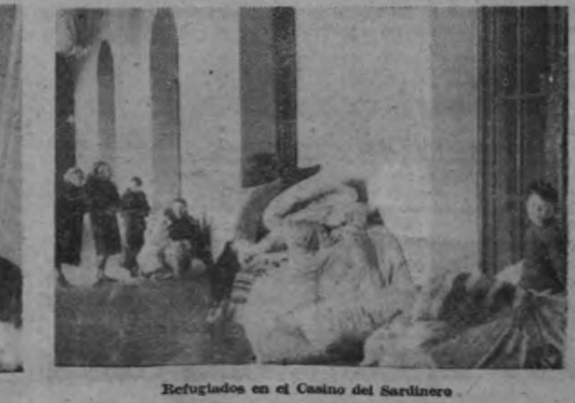
Refugiados en el Casino del Sardinero