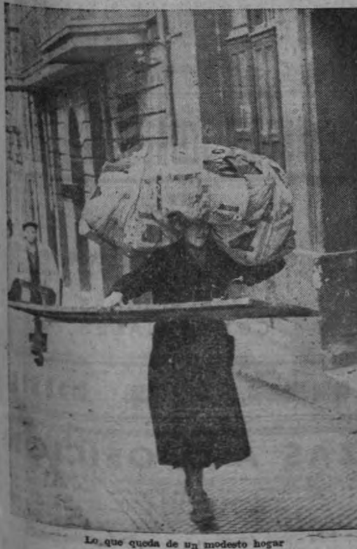
Lo que queda de un modesto hogar