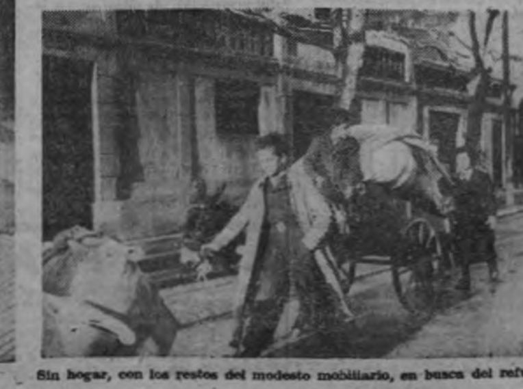
Sin hogar, con los restos del modesto mobiliario, en busca del refugio