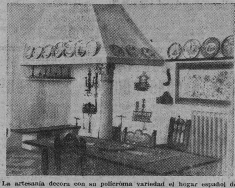
La artesanía decorará con su polícroma variedad el hogar español de siempre.

"¡TUO RECHAZAR Y DAR POR NO OÍDA TODA VOZ DEL AMIGO O ENEMIGO QUE PUEDA DEBILITAR EL ESPIRITU DE LA FALANGE"