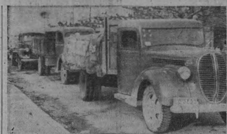
Los primeros convoyes de víveres hacen su entrada en la ciudad.

"Profundamente conmovido y emocionado ante tremenda desgracia acaecida en vuestra ciudad, ruego que en nombre de esta Corporación mi más viva condolencia y la seguridad de que Madrid no ha de olvidar a la ciudad heroica en momentos de tanto dolor y tanto sufrimiento. Haga partícipe de estos sentimientos de la Corporación madrileña a todas las autoridades de esa hermosa población. Salúdale con todo afecto, Alcocer."