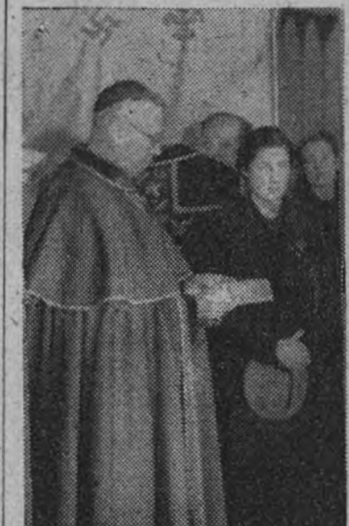
El obispo de Cartagena leyendo su discurso.

El obispo de Cartagena respondió al embajador