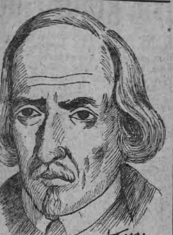
CALDERÓN DE LA BARCA

Para entendernos pronto: "los públicos" son una invención del liberalismo; "el público", una invención de la democracia.