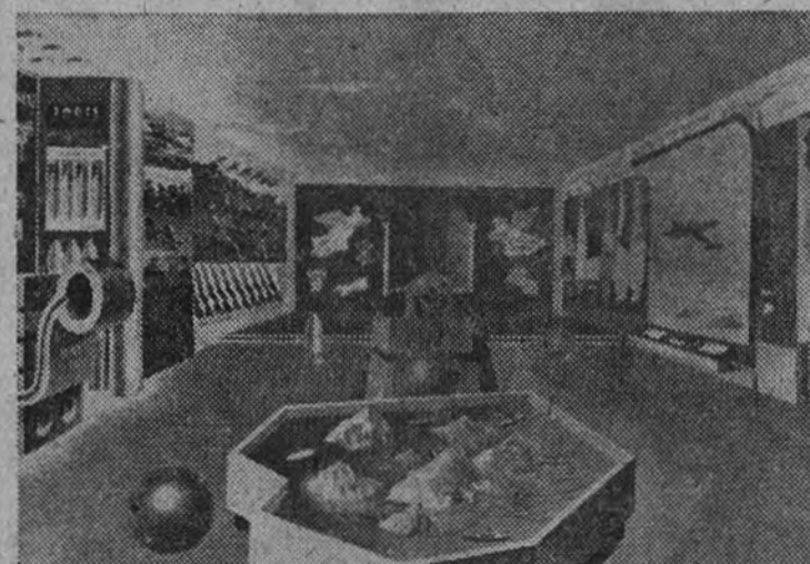
Así será la Sala representativa de la intervención de las Islas Canarias en el glorioso Movimiento. Al fondo la Cripta de los Caídos.

Piensa en tus hermanos que lo han perdido todo y acude a entregarles ropas, zapatos y prendas de abrigo que los proporcionarán un poco de bienestar.