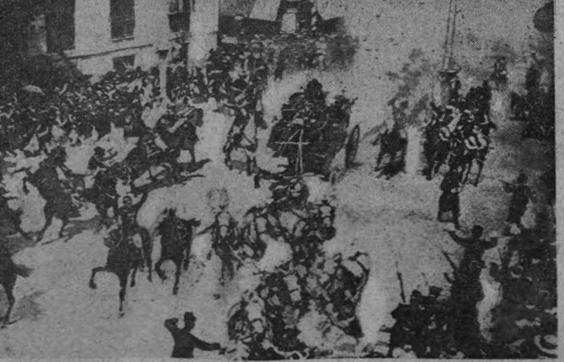
La boda de Don Alfonso XIII le hizo dos veces histórica el hábito atestado de que fue objeto en la calle Mayor, a su regreso a Palacio

Ayer por la tarde el ministro de Asuntos Exteriores estuvo en el hotel Ritz visitan-