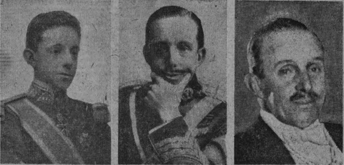
Alfonso XIII en tres épocas distintas de su vida: a su mayoría de edad, durante su reinado y poco tiempo antes de su muerte.

El día 3 se celebrarán en toda España solemnes funerales