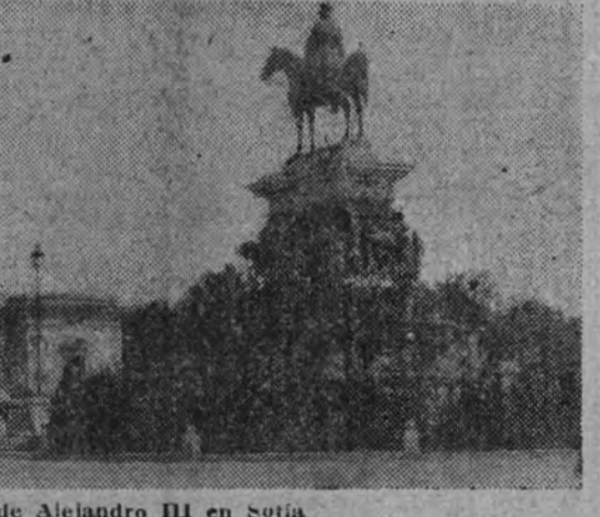
El Parlamento y la estatua de Alejandro III en Sofía

VIENA 1.—Oficialmente se anuncia que Bulgaria se ha adherido al Pacto tripartito mediante un documento diplomático firmado por von Ribbentrop, el conde Ciano y el profesor Filoff, presidente del Consejo búlgaro. El texto del protocolo es idéntico al de la adhesión de Hungría, Rumania y Eslovaquia.