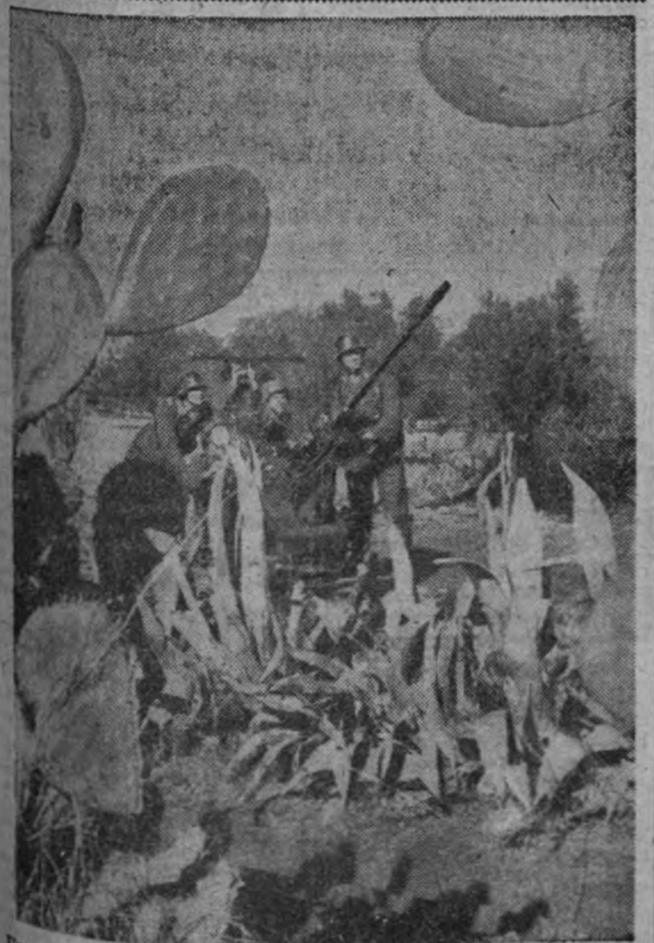
Una batería alemana del Cuerpo expedicionario que actúa en los frentes italianos.

En el día del Patrón de los estudiantes, tan religiosa y disciplinadamente celebrado ayer en toda España, queremos solamente destacar, señalar, esa anticipación, esa realidad cierta y asombrosamente honda que la creación reciente de la Milicia Universitaria representa. Estamos bien seguros que al encauzar la Universidad española en la doble milicia del servicio del espíritu y de las armas se crea una juventud intelectual plenamente ambiciosa y se sirven al par los indeclinables destinos de España y los de una ardiente catolicidad a ellos ligada de una manera fiel. Como estamos seguros que la plenitud total de España—y cuanto ella representa en el orden religioso y universal, además del patriótico—sólo incumbe, por interpretar totalmente el nuevo vivir hondo de los hombres jóvenes o viejos de la Patria, a nuestra Falange, en cuyo clima caben todas las verdades permanentes.