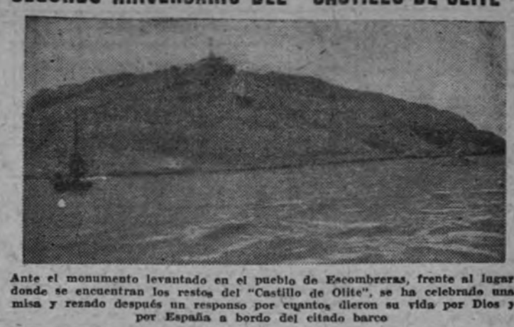
Ante el monumento levantado en el pueblo de Ecombreras, frente al lugar donde se encuentran los restos del "Castillo de Olite", se ha celebrado una misa y rezado después un responso por cuantos dieron su vida por Dios y por España a bordo del citado barco

SEGUNDO ANIVERSARIO DEL "CASTILLO DE OLITE"