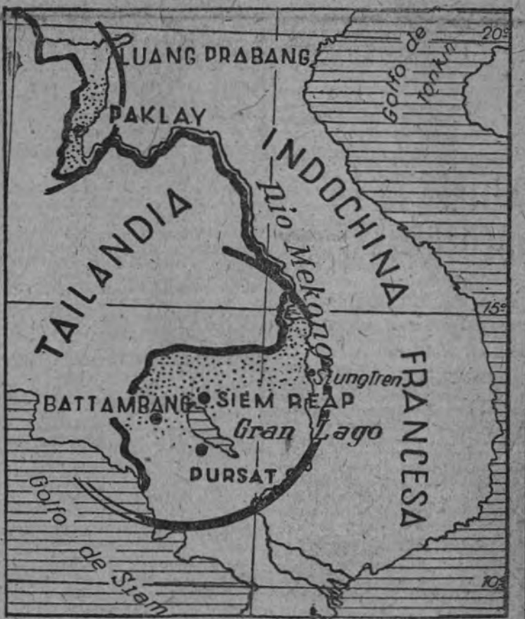
Las regiones de Paklay y Battambang Siemreap, que ahora recobra Tailandia en virtud del arbitraje nipón

Tokio garantiza la naturaleza definitiva del reglamento establecido