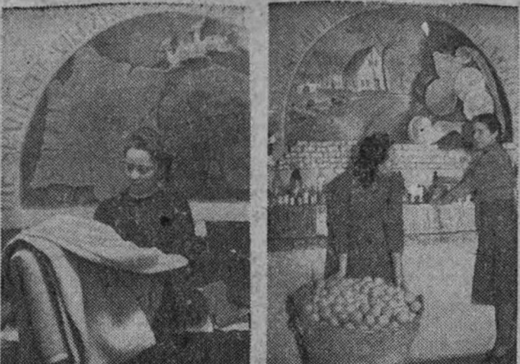
España está representada en la Feria de Leipzig con diversos artículos y productos. Las dos fotografías recogen dos aspectos del "stand" español en dicho importante certamen.