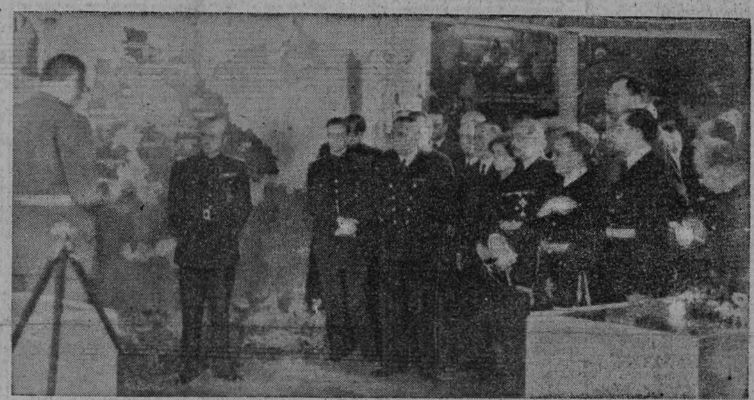
EL EMBAJADOR DE ALEMANIA PRONUNCIANDO SU DISCURSO ANTE EL MINISTRO DE ASUNTOS EXTERIORES