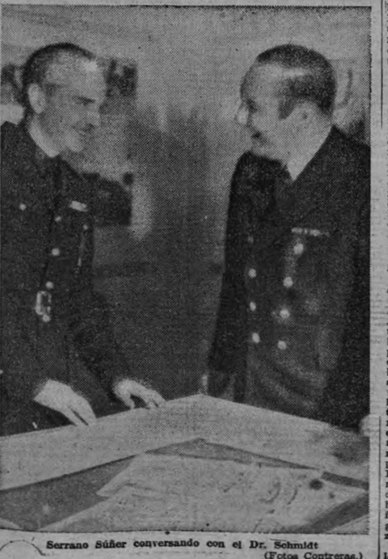
Serrano Suñer conversando con el Dr. Schmidt

LA COLABORACION DE NUESTRAS PRENSAS Para terminar, permitidme que celebre esta colaboración feliz de nuestras Premsas y que exprese mi ferviente deseo de que cada día se haga más estrecha para el mejor reconocimiento recíproco de nuestros pueblos. Aquella lejanía romántica y casi inaccesible en la que durante siglos vivieron separados ha sido trocada en proximidad por la prueba de sangre y de heroísmo al servicio de una causa común: el destino de una nueva Europa. ESPAÑA Y ALEMANIA TIENEN DERECHO A LA PLENITUD DE SU GRANDEZA Y SU LIBERTAD Demasiado superficialmente muchos pensaron que la amistad espontánea y desinteresada que siempre existió entre España y Alemania, aun a pesar de la distancia y del aislamiento, era debida a que por ello no teníamos problemas que suscitasen diferencias. Yo creo, por el contrario, que ha sido y es, precisamente por que en el fondo tenían el mismo sentimiento de dos grandes pueblos y dos grandes Historias, tratadas injustamente en su patrimonio natural y en su honor por los detentadores del poder internacional. Por eso hoy saludamos al propósito victorioso del pueblo alemán de organizar una Europa más justa y más conforme con el pasado y el presente de honor y de gloria de dos pueblos que, como Alemania y España, tienen derecho a la plenitud geográfica y moral de su grandeza y de su libertad. ¡Arriba Alemania! ¡Viva Hitler!