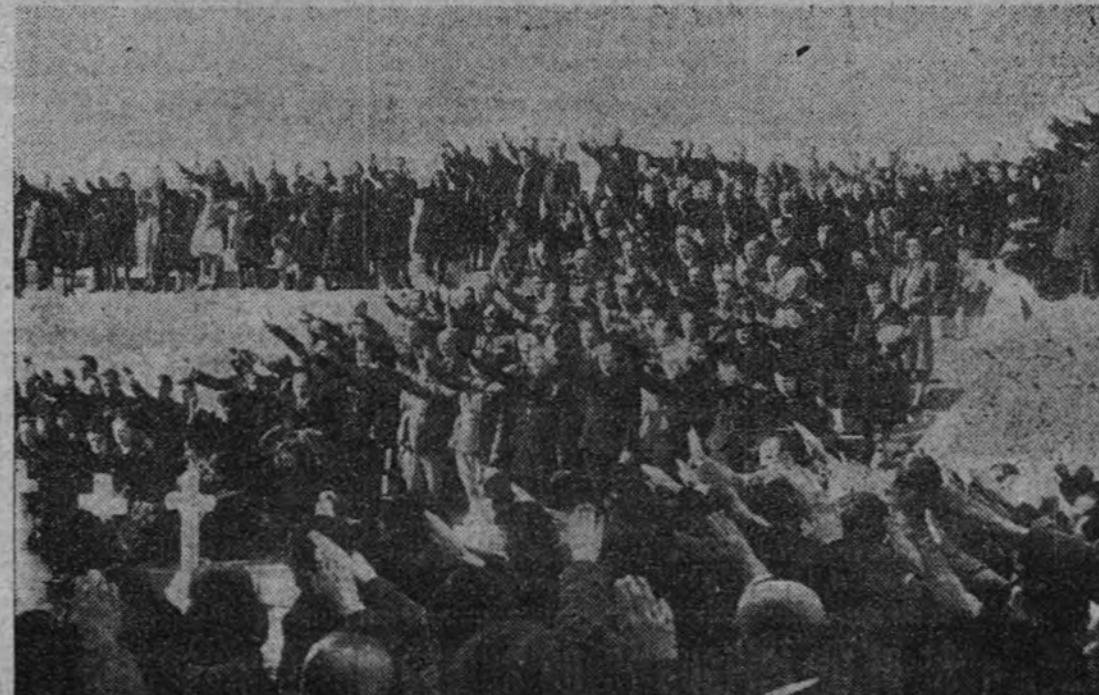
La Falange y los familiares de los supervivientes y caídos, cantando braso en alto el "Cara al sol", al terminar la ceremonia.