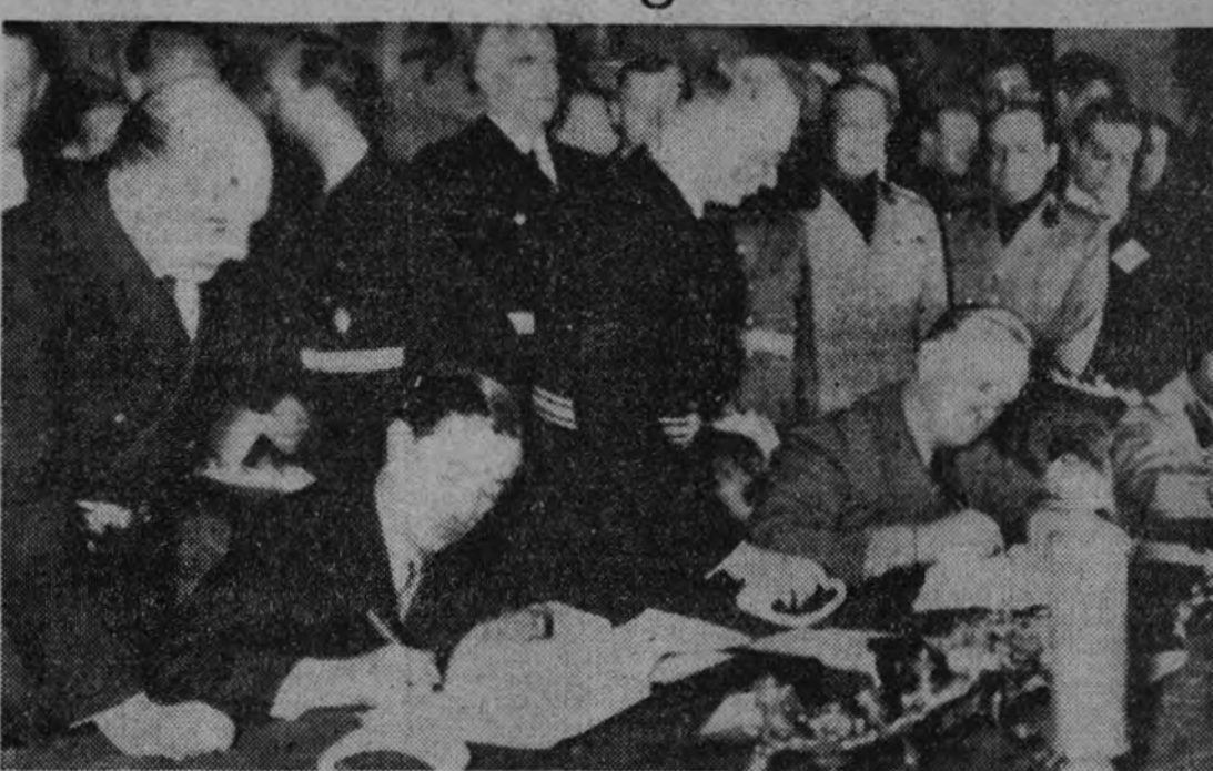
Ceremonia de la firma de la adhesión yugoslava al Pacto tripartito, por von Ribbentrop y el jefe del Gobierno de Belgrado, Zvetkovitch, pocas horas más tarde destituido y detenido, y ahora puesto en libertad.