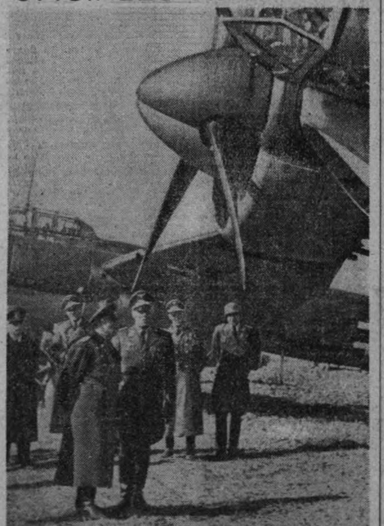
En un aeródromo de Bulgaria, donde han aterrizado aviones de las fuerzas alemanas, el Rey Boris se reúne con los oficiales del Reich.