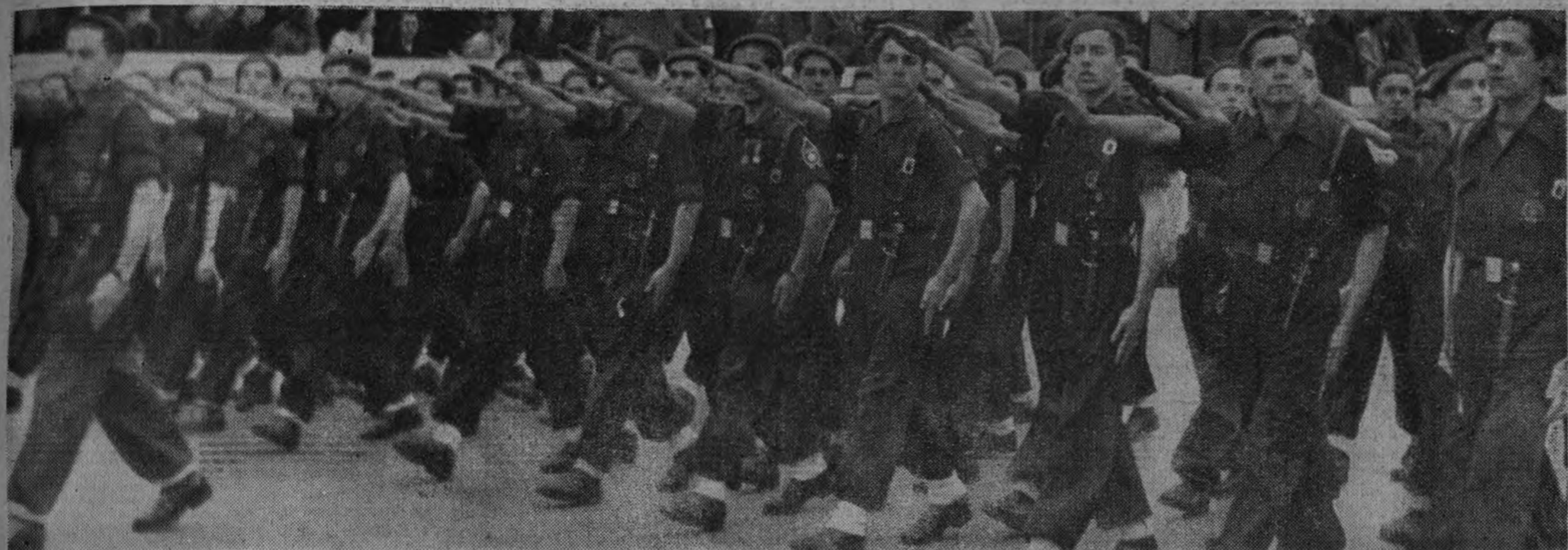
La próxima promoción falangista, encuadrada en las filas del Frente de Juventudes, desfila ante el Jefe Nacional bajo el guión de nuestro Frente de Juventudes. En el paso preciso y firme de los muchachos de la camisa azul, en la tirantez gimnástica de sus brazos y en la general apostura de su juventud reside lo mejor del porvenir español. Ayer, bajo la lluvia, estos chicos trajeron al desfile la promesa de eterna fidelidad a España y a su Caudillo.

ROMA 1.—Con motivo del segundo aniversario de la Victoria, el encargado de Negocios de España en Italia ha ofrecido hoy una recepción, a la que han asistido el personal de las Embajadas y las jerarquías de F. E. T. y de las J. O. N. S., la colonia española y numerosas personalidades. Reinó gran camaradería entre los asistentes al acto, quienes aprovecharon esta ceremonia para ratificar su fe en España y su adhesión al Gobierno español y al Caudillo.