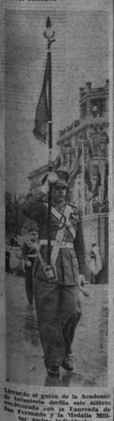
Llevaron el guión de la Academia de Infantería desfilando este alférez condecorado con la Laureada de San Fernando y la Medalla Militar, ambas individuales

ROMA 1.—El conde Ciano ha ofrecido una comida en honor de Matsuoka y de su séquito. Al terminar el banquete el ministro italiano pronunció un discurso, en el que resaltó la amistad y solidaridad entre el Japón, Alemania e Italia, que es muy anterior al Pacto. Con la victoria de nuestros tres pueblos alcanzaremos la finalidad que el Pacto tripartito aspira de establecer un nuevo orden mundial. En nombre del Duce—terminó—levanto mi copa en honor de nuestro Emperador y hebo a vuestra salud y a la de nuestro Gobierno, por la grandeza y prosperidad de nuestro país.