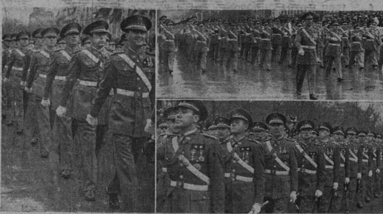
Los caballeros alumnos de las Academias Militares a su paso ante la tribuna del Generalísimo.

En la mañana de ayer, a las once y media, el Caudillo abandonó la tribuna, acompañado por el ministro del Ejército, cuando estallaron las aclamaciones de la gente, y los sonos de las banderas militares, resonaban fuertemente. El Caudillo, brazo en alto, respondía a la multitud. El pueblo madrileño renueva en aclamaciones delirantes su fe en Franco. Cae la lluvia, y ella parece que contribuye a enardecer al gentío inmenso: todo Madrid volcado sobre la avenida del Generalísimo, Recoletos, Cibeles y calle de Alcalá, y las aclamaciones a Franco resuenan con fuerza que emociona. De pronto de entre la multitud surgen unos pequeños que manan de las faldas, trémulas de emoción, agitan al paso de Franco, y en seguida el pueblo todo agita sus pañuelos en el aire, mientras de sus gargantas surgen potentes aclamaciones al Caudillo. El Caudillo cruza entre la multitud enardecida el centro de la ciudad. El momento de llegar al coche del Generalísimo a la plaza de Cibeles fue verdaderamente inenarrable. La multitud que se apiñaba en las aceras y balcones y la que entrinada ocupaba balcones y azoteas lanza al aire de esta lluviosa mañana del 1.º de abril sus aclamaciones al Caudillo. Y así, entre aclamaciones y gritos de entusiasmo, cruza el Generalísimo las calles del centro de la ciudad.