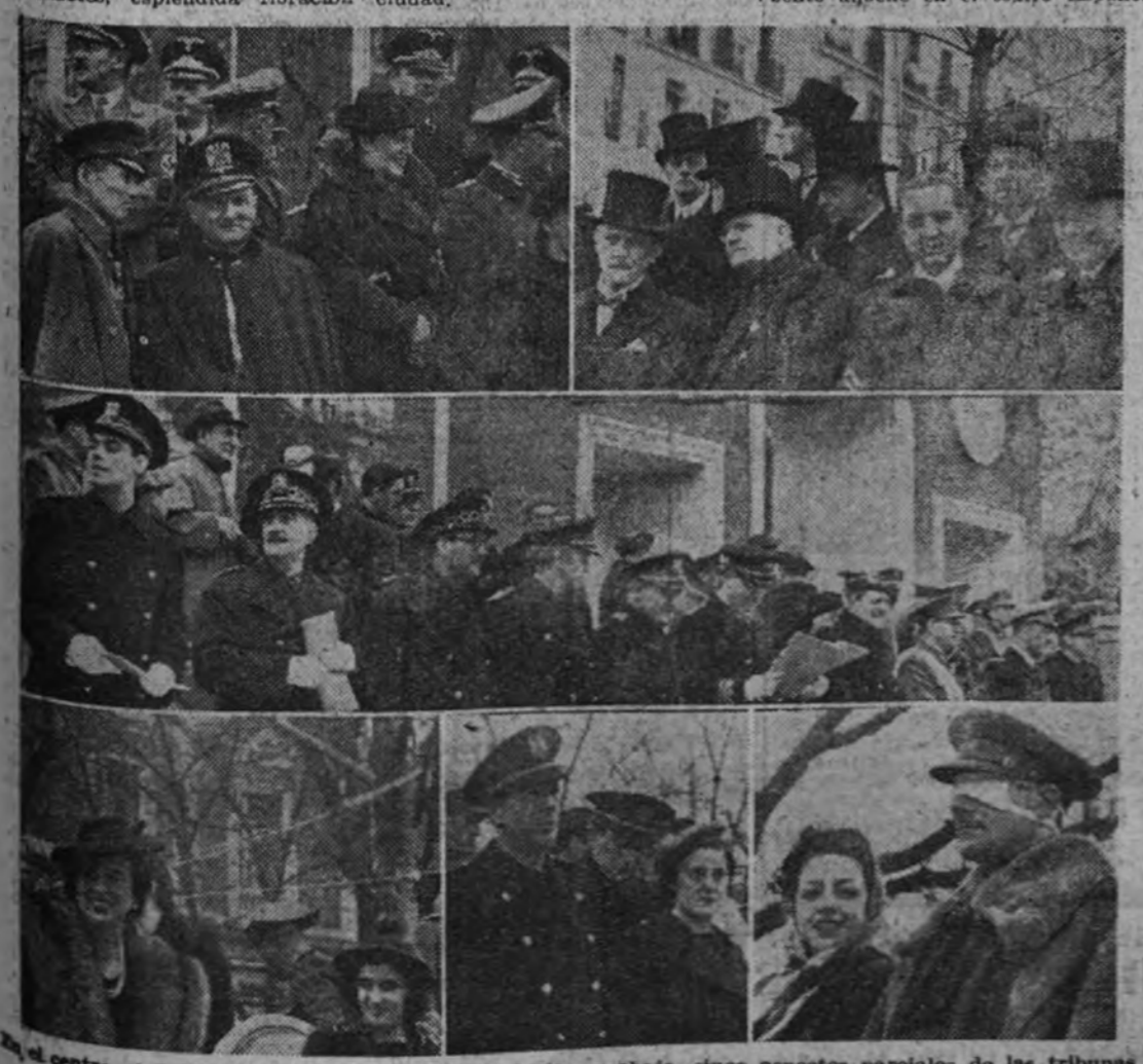
En el centro, el Gobierno presenciando el desfile. Arriba y abajo, cinco aspectos parciales de las tribunas

Por primera vez en la mañana de ayer, han lucido sus enseñas ante el jefe nacional del Partido las Milicias Universitarias de reciente creación, y por primera vez también han vestido su brillante uniforme. Al divisar el gentío a los nuevos cadetes, espléndida floración