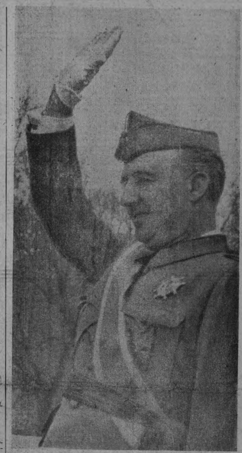
Franco, Caudillo de España y Jefe Nacional de la Falange, saluda al paso de las juventudes militantes de la Patria.