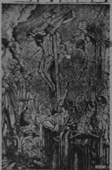
"Martirio", por Antonio Cobos

100 plazas para Intervención Militar. Instancias, del 1 al 31 de julio.—45 de Ayudantes de Obras Públicas. Instancias, del 1 al 20 de abril.—156 para Notarías. Instancias hasta el 18 de abril. Exámenes en mayo.—2.000 para Auxiliares de Correos, con 4.000 pesetas. Se admiten seforistas. Instancias, hasta el 1 de mayo. Número limitado de plazas para Radiotelegrafistas. Instancias, del 1 al 31 de agosto.—116 de Auxiliares de Contabilidad de Hacienda, con 4.000 pesetas. Instancias, del 1 al 30 de abril. Se admiten seforistas. 20 de Ingenieros Aeronáuticos. Instancias, hasta el 1 de mayo.—60 de Liquidadores de Utilidades. Instancias, hasta el 30 de abril.—Para programas, "Contestaciones" y preparación para dichos Cuerpos, presentaciones de instancias, etc., etc., dirijase a: "INSTITUTO EDITORIAL REIS", Preclados, 23 y 6, y Puerta del Sol, 12. Madrid. Reglamos prospectos. Único Centro que ha obtenido el número 1 en más de 70 oposiciones y miles de plazas para sus alumnos.