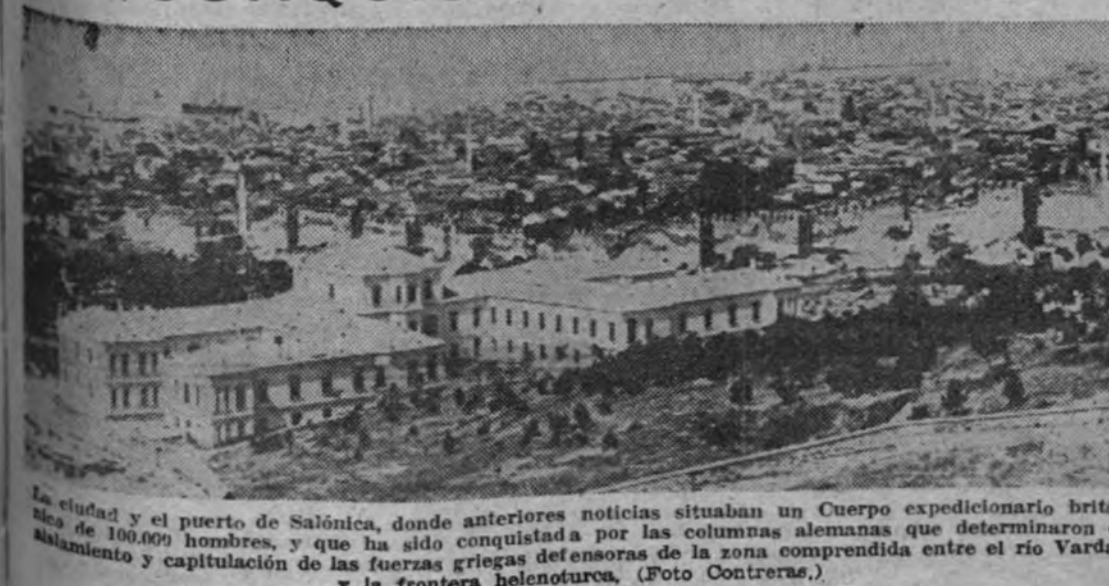
La ciudad y el puerto de Salónica, donde anteriores noticias situaban un Cuerpo expedicionario británico de 100.000 hombres, y que ha sido conquistada por las columnas alemanas que determinaron el aislamiento y capitulación de las fuerzas griegas defensoras de la zona comprendida entre el río Vardar y la frontera helenoturca.