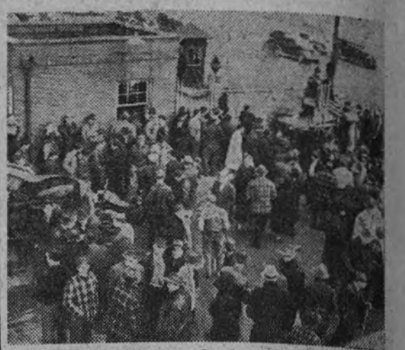
Grupo de huelguistas escuchando a un orador espontáneo mientras llegan más automóviles que volcar

Los pueblos, desde luego, tienen lo que desean, y por lo tanto, es algo que excede a nuestro empeño situarnos ahora en cualquier actitud de compasión. Si broma divertida ni seriedad solemne nos producen estas fotografías. Simplemente extrañeza ante una prueba como ésta de supervivencia. Y el año de que España no olvide lo pasado, junto con el deseo de que Estados Unidos—si lo estima oportuno—lo recuerde también.