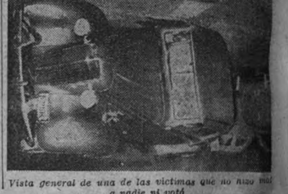
Vista general de una de las víctimas que no hizo nada a nadie ni votó