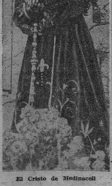
El Cristo de Medinaceli

Este soldado penitente cumple su voto siguiendo el recorrido de la procesión descalzo y con los brazos en cruz