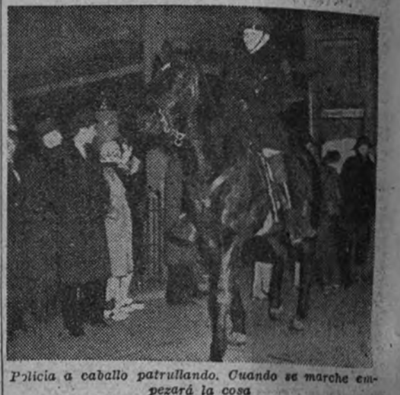
Policia a caballo patrullando. Cuando se marche en paz la cosa