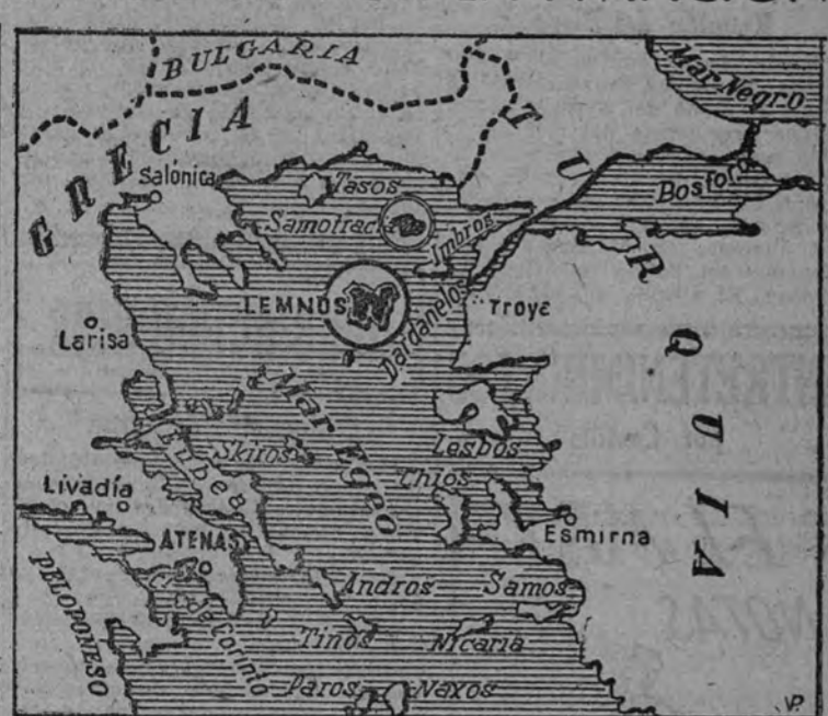
Los alemanes, que hace días conquistaron la isla de Samotracia, han desembarcado ayer en la de Lemnos, los dos pertenecientes a Grecia, y las cuales, con la fuerza de Imbros, tienen una importancia decisiva para la zona de los Estrechos.

TANGER 25.—El "Boletín Oficial" del Protectorado publica una breve ordenanza del Alto Comisario por la que se crea el Patronato de Investigación y Alta Cultura de Marruecos y se establecen normas generales para su funcionamiento. En la parte positiva se dice: "España y Marruecos tienen un nuevo destino que cumplir: el renacimiento de la cultura hispanoárabe. Esta fijación de ideas se produce en las circunstancias más favorables para su desarrollo. El Jefe de Muley Hassan lleva el sello bien definido de ayuda a la cultura y a las artes en todas sus manifestaciones. El Jefe de Muley Hassan es el protector más decidido y entusiasta del renacimiento espiritual de su pueblo. España, regida por Franco, comprende este desenvolvimiento y estimula con todas sus fuerzas esta obra común." El Patronato estará regido por el Jefe, como presidente de honor; Gran Visir, como presidente efectivo; secretario general del Protectorado y presidentes de las demás entidades de carácter cultural y científico, como vocales. (Cifra.)