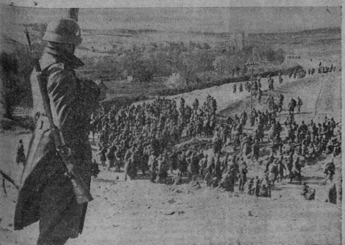
Una escena que nos recuerda los meses preteritos de la guerra española: largas columnas de prisioneros cruzan por las carreteras de Servia; todo un Ejército en derrota que se entrega a sus vencedores, después de la victoriosa campaña.