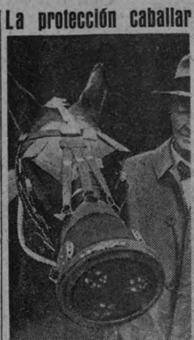
Las Sociedades Protectoras de Animales no pierden el tiempo en Inglaterra. Al cabo de importantes discusiones técnicas, los caballeros han encontrado esa carota antigua que une a sus excelentes condiciones preventivas una elegancia de líneas que no deja lugar a dudas.