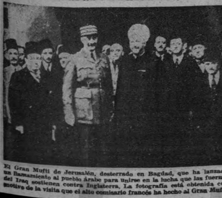
El Gran Mufti de Jerusalén, desterrado en Bagdad, que ha lanzado un llamamiento al pueblo árabe para unirse en la lucha que las fuerzas del Iraq sostienen contra Inglaterra. La fotografía está obtenida con motivo de la visita que el alto comisario francés ha hecho al Gran Mufti.