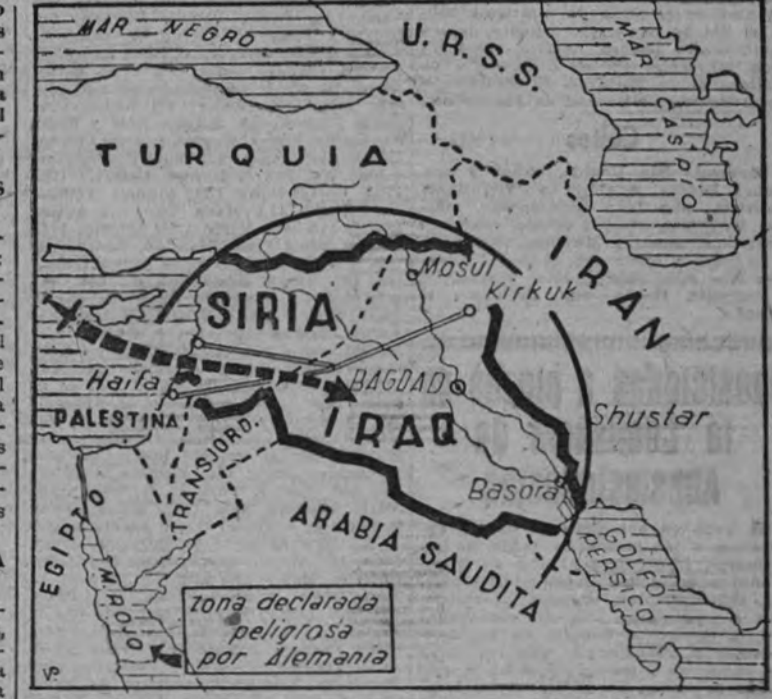
Informaciones de Reuter y El Cairo sitúan a las fuerzas aéreas del Reich en Siria y el Iraq. Aunque la noticia no ha tenido confirmación oficial, parece indudable que este nuevo escenario de la guerra puede ser utilizado por Alemania, que acaba de declarar zona peligrosa la parte norte de, mar Rojo. De otra parte, los milis iraqueses siguen sus gestiones en los países vecinos, y hasta el Yemen plantan ahora viejas reivindicaciones sobre nuevo distrito de influencia inglesa.

regresado a sus bases sin pérdida alguna. Bagdad fue bombardeada por un aparato inglés, pero no hay que lamentar destrucción. También fue atacada una ciudad del Sur del país, pero las bombas, lanzadas al azar, no han causado daños. Cerca de Kerbella un bombardeo enemigo se estrelló contra el suelo. El piloto resultó muerto y los otros dos ocupantes del aparato, que están heridos, han sido hechos prisioneros. En el desierto occidental nuestras fuerzas de tierra han efectuado algunas operaciones contra las posiciones enemigas."