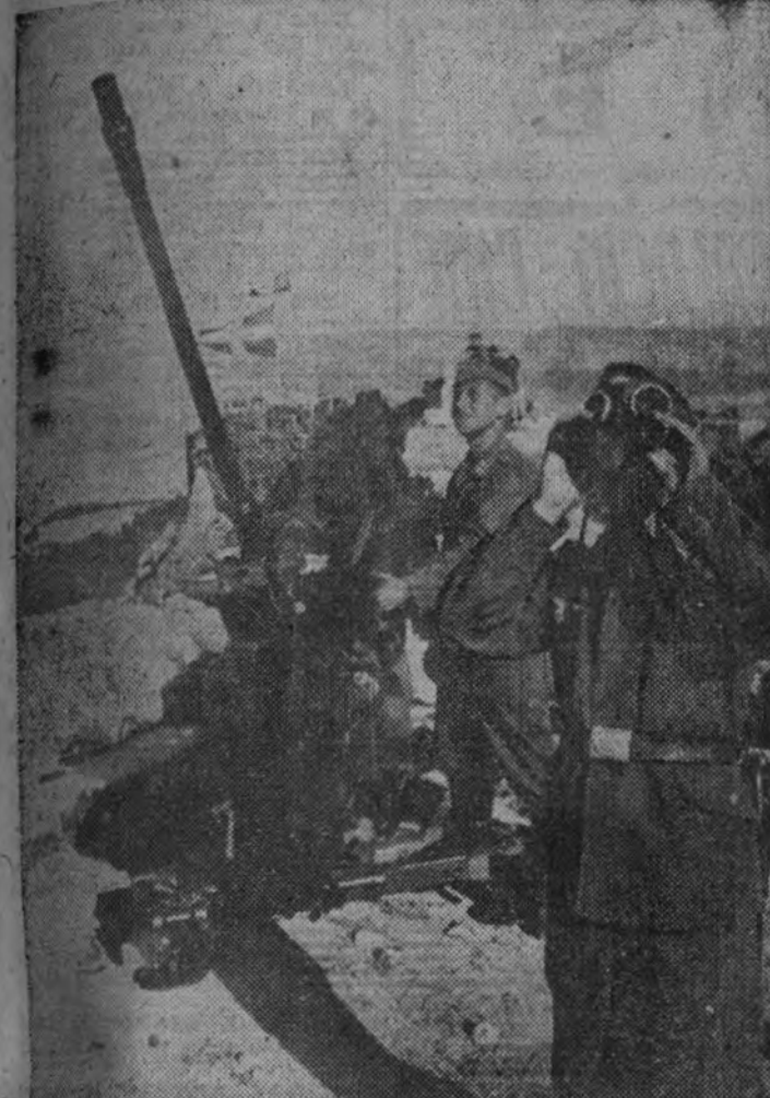
El primer término, una pieza antiáerea alemana de 37 milímetros. Al fondo, las banderas de Alemania e Italia, que ondean sobre los muros de la Acrópolis de Atenas.