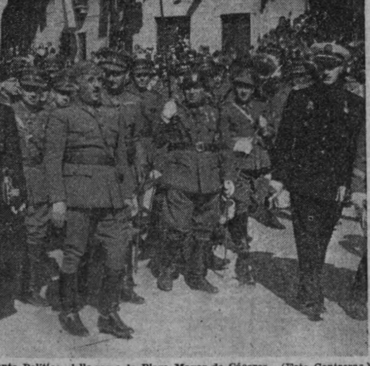
El Caudillo y el Presidente de la Junta Política al llegar a la Plaza Mayor de Cáceres.

El pantano de Rosarito está situado en el mismo límite de las provincias de Cáceres y Toledo. Una vez que se terminen las obras 13.000 hectáreas de terreno quedarán convertidas en regadío. El pantano tendrá una capacidad de 67 millones de metros cúbicos y una altura de presa de 23,70 metros. Su coste se calcula en más de ocho millones de pesetas. La importancia de estas obras es considerable, porque en toda la zona de la Vera hay una población campesina que conoce perfectamente la técnica del regadío y sólo necesita que se le provea de agua. Ha servido de experiencia la obra realizada en Mesillas, del término de Aldeanueva de la Vera, donde se ha logrado una perfecta colonización y, en breve, surgirá un pueblo que se llamará Villa Franco, compuesto por toda la población trabajadora, que será el mismo tiempo propietario. (Cifra.)