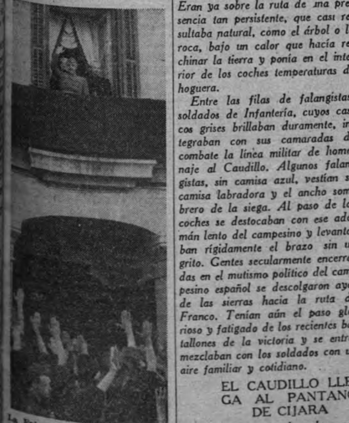
El Caudillo llega al pantano de Cijara.

El Caudillo, que había pasado la noche en una finca de los alrededores de Oropesa, emprendió el viaje hacia las obras de Cijara a las nueve y media de la mañana. Sobre las tierras de Oropesa y