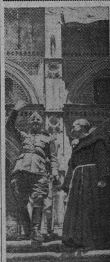
El Caudillo y el prior del Monasterio saliendo de orar ante la imagen de Nuestra Señora de Guadalupe.

BERLIN. (S. E. T.).—En un centro militar autorizado se comunicó a la agencia Transocean: “En las primeras horas de la mañana del lunes se reanudó la batalla en el frente de Sollum (Africa del Norte). Los ingleses, que ya en la primera jornada perdieron 60 tanques, volvieron ayer al ataque con potentes fuerzas blindadas. La defensa germanoitaliana logró rechazar la nueva tentativa, infligiendo asimismo durísimas pérdidas al adversario. De acuerdo con las noticias recibidas, hasta ahora, plenamente confirmadas, hasta mediodía del lunes los ingleses perdieron nada menos que cien tanques. Los combates se desarrollan favorablemente para las potencias del Eje. En Tobruk la situación continúa estacionaria.” (Efe.) COMUNICADO BRITANICO EL CAIRO 17.—“Libia: Mediante un movimiento de sorpresa nuestras tropas han efectuado una penetración inicial en las líneas enemigas hasta Fuerte Capuzzo. Han sido enviados apresuradamente numerosos refuerzos enemigos desde la región de Tobruk, y los numerosos y resueltos contrataques han sido rechazados hasta ahora con grandes pérdidas para el enemigo. Continúan las operaciones. Abisinia: El 15 de junio, después de vivos combates, nuestras tropas africanas ocuparon una posición de la retaguardia enemiga al oeste de Lakemti, en la que hi-