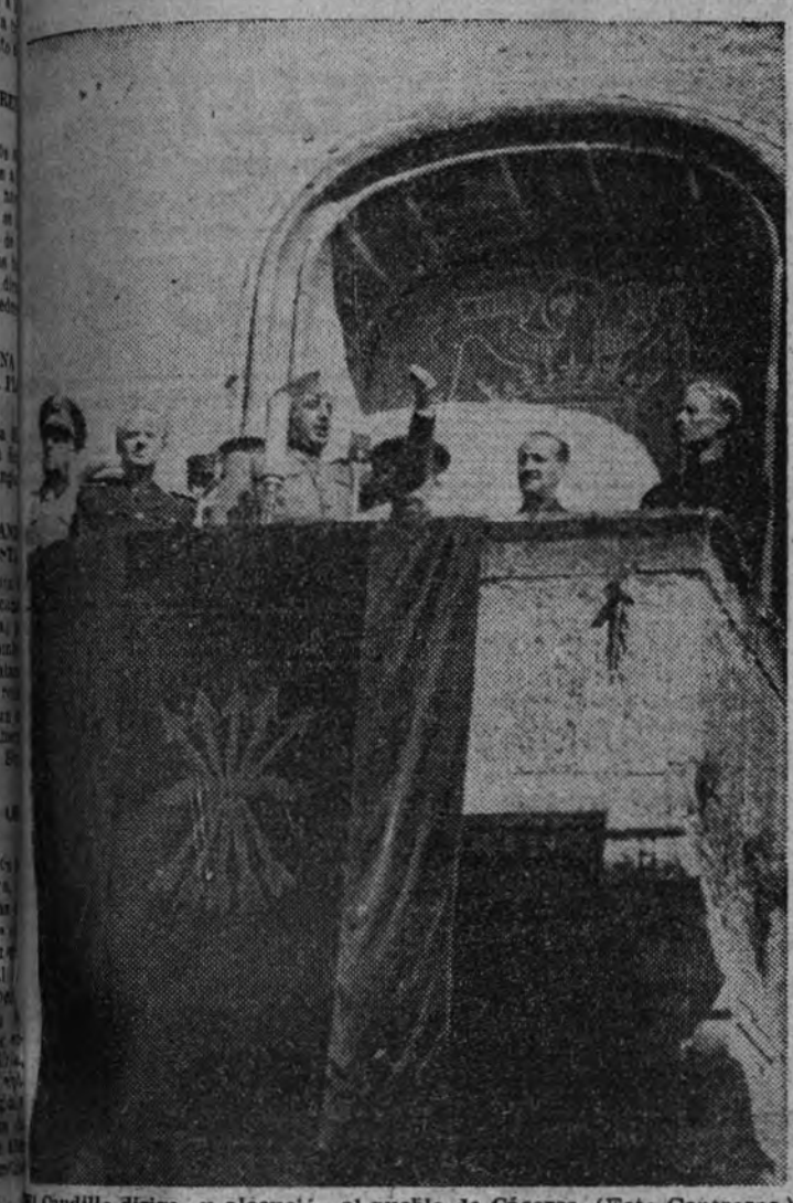
El Caudillo dirige su alocución al pueblo de Cáceres.

(De nuestro enviado especial, Ismael Herráiz) Desde los mismos umbrales de Cáceres, en los cuales se adelantaba la roca al aire oloroso a canchales y tomillo, hasta el amarillento de la muralla de Cáceres, la Falange extremaña tendió la línea férrea de su alero, en el paso de la caravana. Nos dicen que ante nuestro jefe Nacional desfilaron en la Plaza Mayor de Cáceres quince mil falangistas; pero, en realidad, la exacta expresión de la imponente Falange extremaña estaba en aquel delirante desfile de la capital, sino en esa silenciosa y disciplinada guardia que, en un solo espasmo, formó a lo largo de más de cien kilómetros. (Antes de casi todas las grandes concentraciones políticas de nuestra Falange, podemos afirmar que, en cuanto a su dimensión sobre tierra española y en cuanto a la integración total del hombre con la tierra, acaso la formación falangista de ayer no tenga igual.)