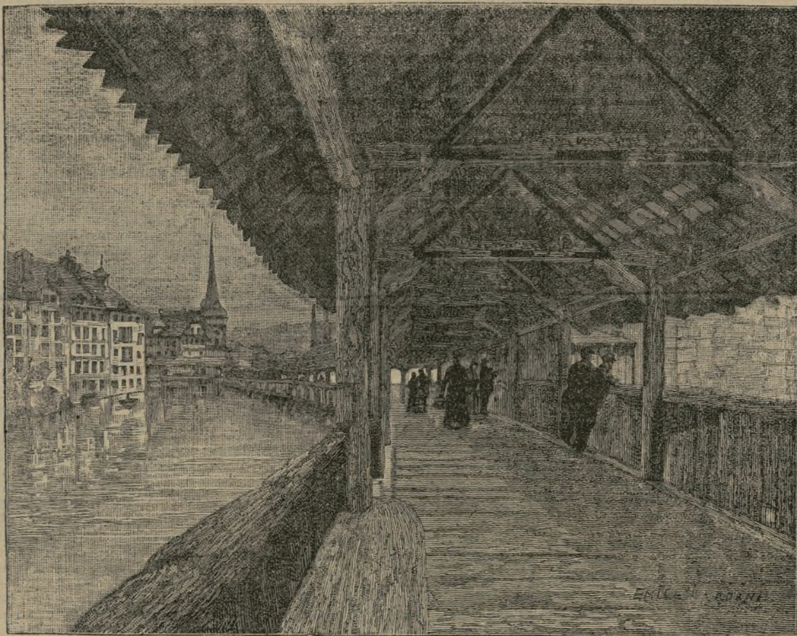
Puente cubierto en Lucerna.