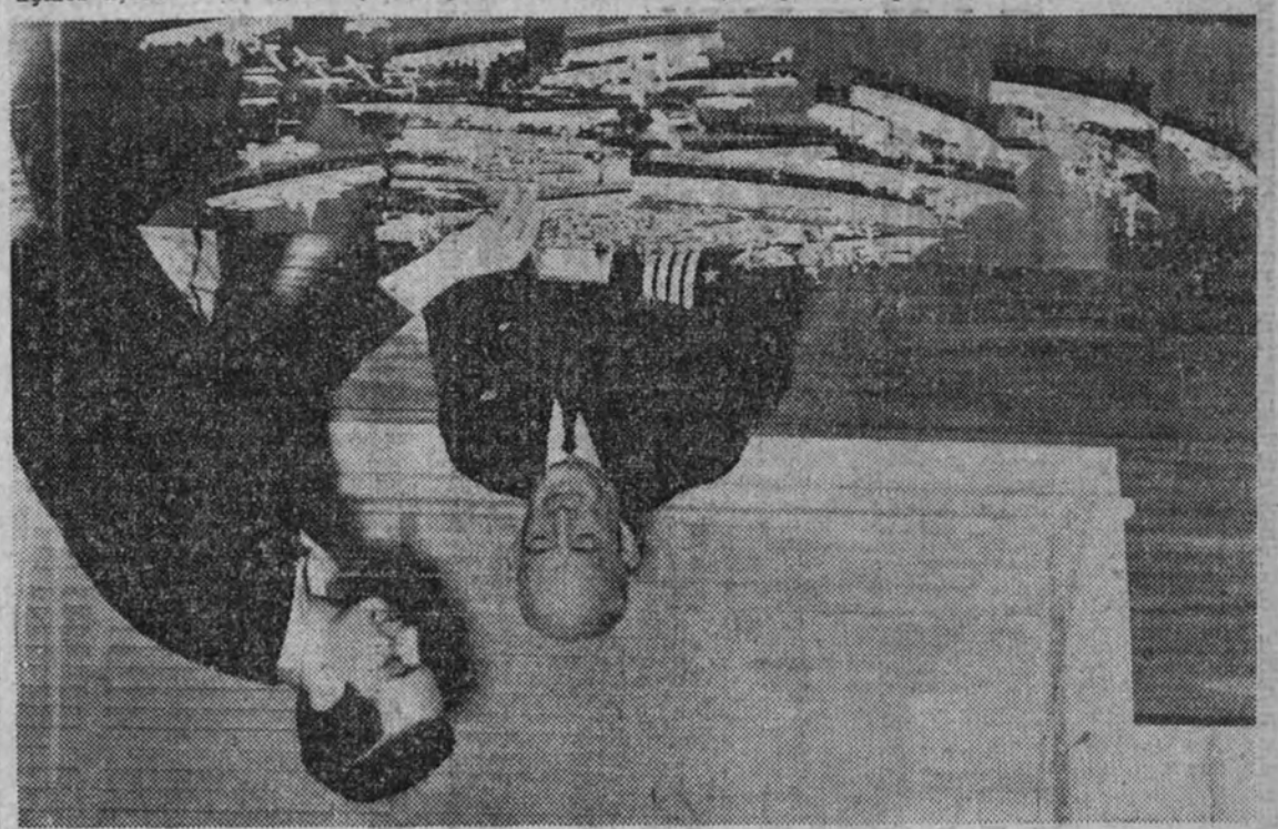
Un juego que instruye y deleita

El Sr. Carrasquilla, ministro de Industria y Comercio, dio a conocer el programa de la Naranja, que es el programa de la Naranja. El Sr. Carrasquilla, ministro de Industria y Comercio, dio a conocer el programa de la Naranja, que es el programa de la Naranja.