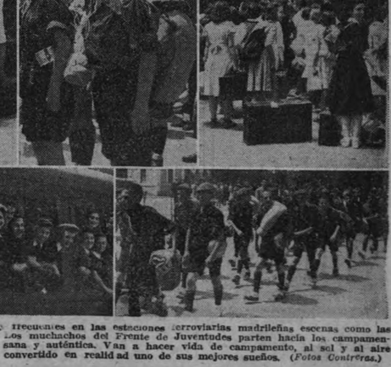
Desde hace unos días son muy frecuentes en las estaciones ferroviarias madrileñas escenas como las que aparecen en esta fotografía. Los muchachos del Frente de Juventudes parten hacia los campamentos de verano y su alegría es sana y auténtica. Van a hacer vida de campamento, al sol y al aire libre, que es tanto como ver convertido en realidad uno de sus mejores sueños.