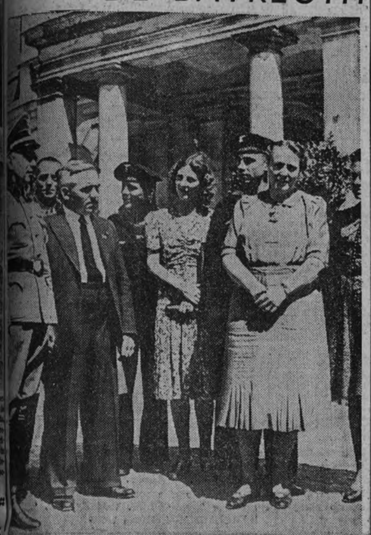
Los festivales de Bayreuth, los más famosos entre las manifestaciones musicales del Reich, han sido concurridos en este año por gran número de soldados. En la fotografía aparece la hija del gran compositor, Richard Wagner con sus familiares.