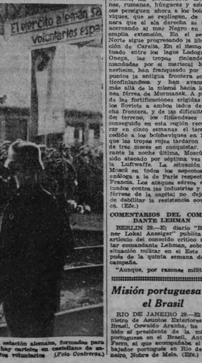
Fuerzas de la División Azul en una estación alemana, formadas para hacer una comedia. En la estación hay carteles en castellano de salutación a nuestros voluntarios.

El ejército alemán en la División Azul en Alemania