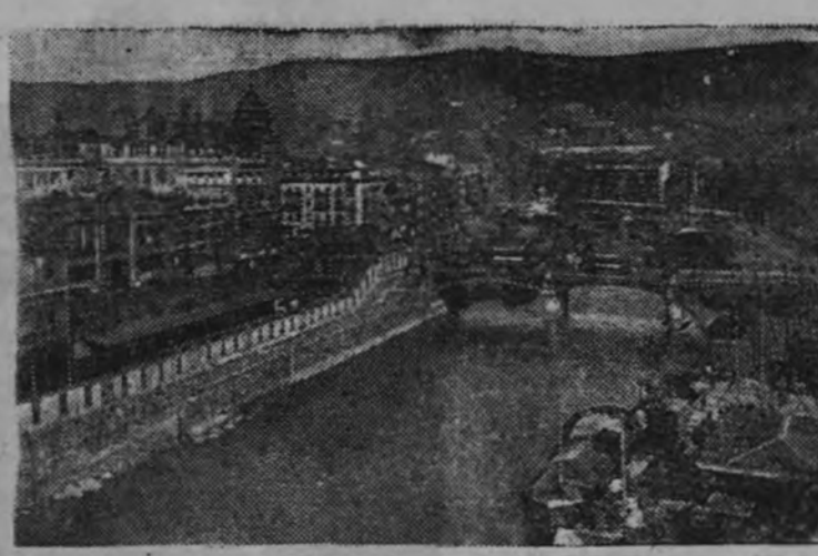
La Ría y Puente Isabel II.