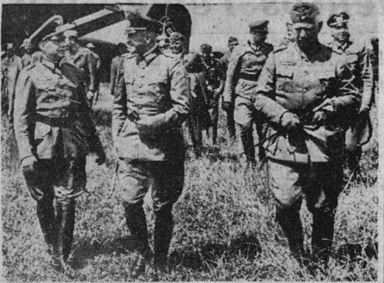
Los generales alemanes von Kleist, von Brauchitsch y von Litzke durante una visita de inspección a las líneas avanzadas del frente del Este.