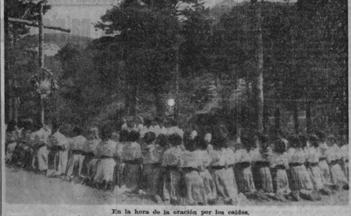
Ejercicios de gimnasia rítmica.