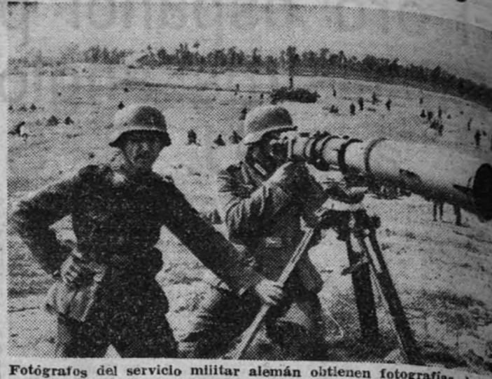
Fotógrafos del servicio militar alemán obtienen fotografías de posiciones soviéticas muy alejadas, por medio de este gigantesco telescopio.