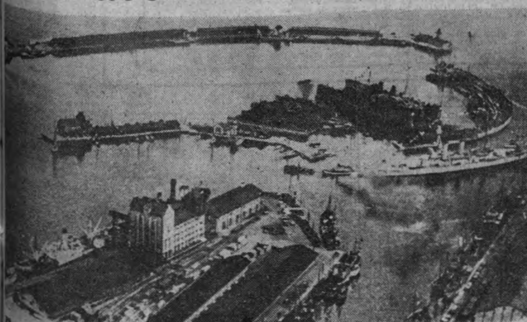
El puerto de Reval (Tallin), convertido por los rojos en fuerte base naval, y que ha sido conquistado por los alemanes, que han concluido la liberación de los Países Bálticos.