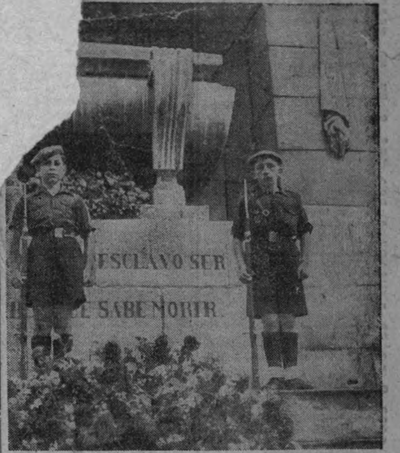
Desde las doce horas de hoy la Falange tiene montada una guardia permanente en el monumento erigido a la memoria de los héroes del Dos de Mayo

BUENOS AIRES 1.—El ministro de Asuntos Exteriores de Argentina desmiente las noticias difundidas por ciertas agencias norteamericanas, según las cuales todos los países de América habían adoptado un plan común para la confiscación de los barcos extranjeros fondeados en los puertos del hemisferio occidental. Se pretendía en estas informaciones que los Estados americanos habían llegado a un acuerdo para vender o arrendar a Inglaterra todos los navíos extranjeros internados en los puertos americanos que estos países no necesitaran para su navegación mercante. El ministerio de Asuntos Exteriores ha publicado al mismo tiempo un comunicado en el que declara que mantiene estrictamente su neutralidad, y afirma que no adoptará medidas con respecto a los barcos extranjeros que puedan