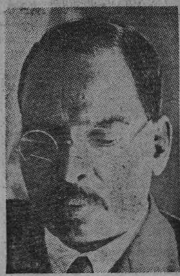
MAHARAJA BAHADUR DE BUDWAN. Era jefe de la principal casa hindú de Bengala y uno de los más destacados personajes de la India, que había pertenecido a la Conferencia Imperial de Londres de 1926.

Asistió a la Conferencia Imperial de 1926