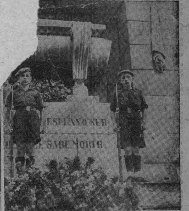
Desde las doce horas de hoy la Falange tiene montada una guardia permanente en el monumento erigido a la memoria de los héroes del Dos de Mayo

BUENOS AIRES 1.—El minis- rio de Asuntos Exteriores de Ar- gentina desmiente las noticias di- fundidas por ciertas agencias nortea- mericanas, según las cuales to- dos los países de América habían adoptado un plan común para la confiscación de los barcos extran- jeros fondeados en los puertos del hemisferio occidental. Se preten- día en estas informaciones que los Estados americanos habían llegado a un acuerdo para vender o arren- dar a Inglaterra todos los barcos extranjeros internados en los puertos americanos que estos países no necesitaran para su navegación mercante. El ministerio de Asuntos Exte- riores ha publicado al mismo tiem- po un comunicado en el que de- clara que mantiene estrictamente su neutralidad, y afirma que no adoptará medidas con respecto a los barcos extranjeros que puedan