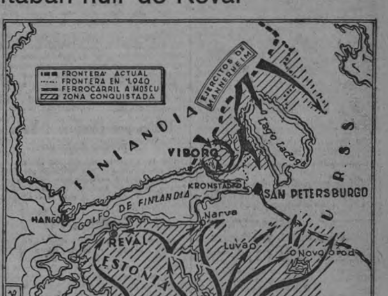
Cercada la ciudad de Viborg en jornadas anteriores, la plaza ha sido ocupada por las tropas finlandesas que, al mismo tiempo, siguen avanzando hacia San Petersburgo, también amenazada por las diversas columnas que conquistan Narva, Luga y Novgorod, y acaban de cortar las comunicaciones de la antigua capital con Moscú.

HELSINKI 30.—El Gran Cuartel General finlandés comunica: "Nuestras tropas han entrado en la mañana de hoy en la ciudad de Viborg (Viborg). Al mismo tiempo que el cerco de Viborg continuó nuestro ataque en forma de cuña profunda, con extraordinario éxito, sobre el istmo de Carelia, donde ha sido conquistado, entre otros, el pueblo de Kivimäki. A las 13 horas, la radio finlandesa ha comunicado a este respecto que la bandera de Finlandia ondeaba ya sobre el castillo de Viborg (Viborg). En todo Finlandia y especialmente en la capital se acogió esta noticia con una alegría sin límites. La información ha sido difundida inmediatamente en emisiones especiales. Numerosas casas han sido engalanadas espontáneamente. (Efe.)"