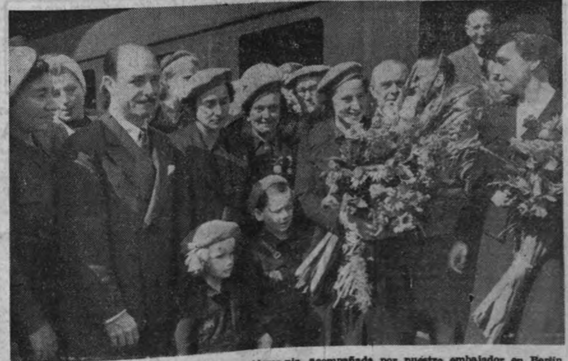
Pilar Primo de Rivera, durante su estancia en Alemania, acompañada por nuestro embajador en Berlín, otros falangistas y juventudes alemanas.

El viaje de nuestro Caudillo a Burgos—capital por derecho propio del anticomunismo—llena de nostalgias y de recuerdos el corazón de los españoles y reaviva, por encima de todo, nuestra esperanza. Creemos en la capacidad de resurrección de la Patria española, en su fuerza creadora y en su prestigio ante el mundo. Y tenemos que creer cuando pensamos, sobre todo, en la milagrosa y esforzada tarea que la gente hispánica supo cumplir entre las viejas torres burgalesas.