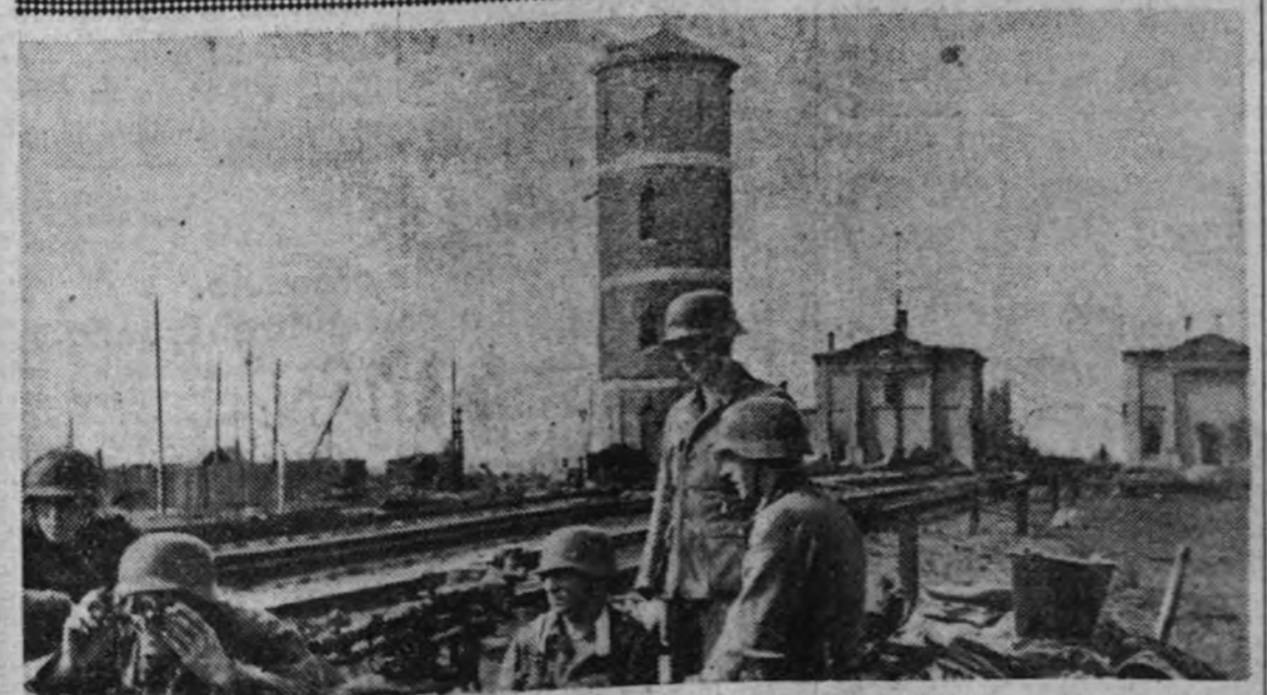
Junto a uno de los ramales ferroviarios más importantes en el camino de Moscú, los soldados alemanes montan sus máquinas automáticas.