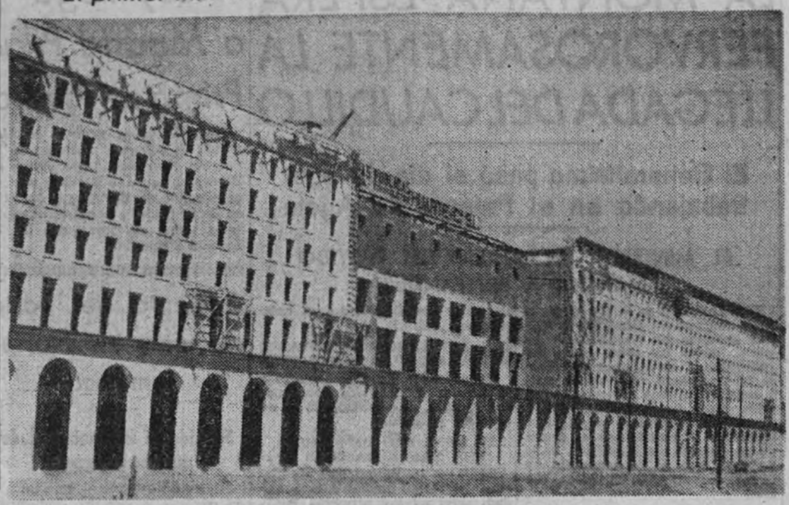
Fachada de los ministerios, terminada en su mayor parte.

El primer ministerio terminado será el de Obras Públicas