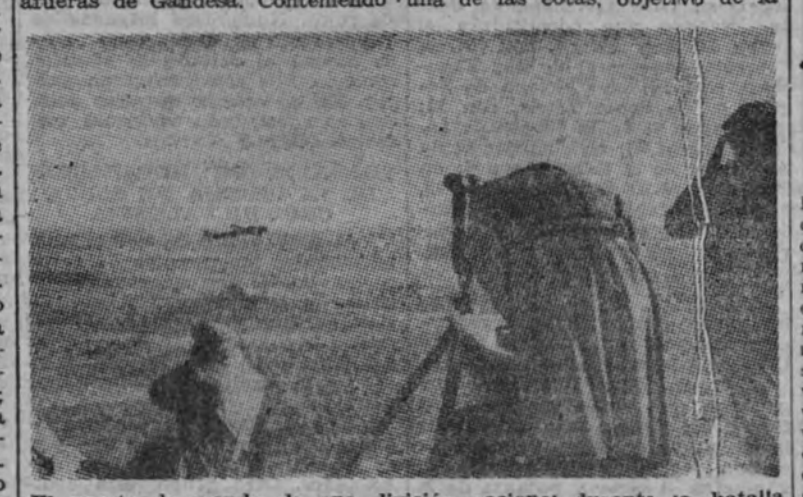
El puesto de mando de una división nacional durante la batalla del Ebro.

Incansablemente se combatió en toda la línea del frente, pero con singular encarnizamiento en las afueras de Gandesa. Conteniendo