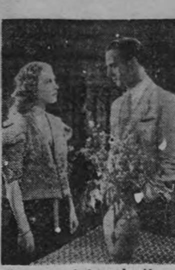
Una escena de la producción española "Sol de Valencia", que presenta el cine Imperial en su segundo programa de la temporada.

TEATRO "Maravillas" EL PRINCIPE VANIDOSO EXITO EXTRAORDINARIO Cine SALAMANCA HOY, CUATRO TARDES Niños: Todos al cine SALAMANCA