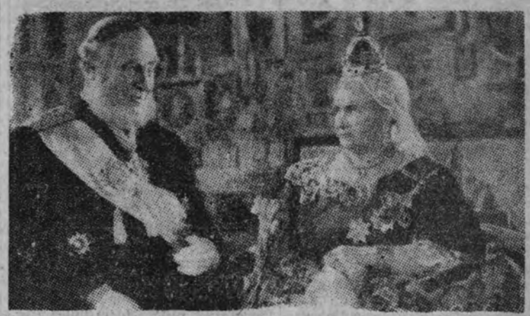
Emil Jannings y Edwig Wangel en una escena del film alemán "Ohm Krüger".

A la Biennale de Venecia concurren también los Estados Uni-