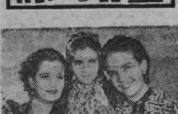
"Jalisco nunca pierde" entra en su séptima semana de exhibición en el Palacio de la Prensa. He aquí una foto en la que aparecen tres de los principales intérpretes de este film.

¡YA ESTAN AQUI! las grandes superproducciones de CINEMEDITERRANEO, S. A. Distribuidas por IMPERIAL FILM