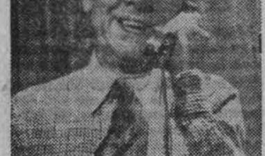
Valeriano León, protagonista de la comedia cinematográfica "¡A mí no me muerdes!", argumento y dirección de José Luis Sáenz de Heredia.

CENTRAL PARK N.º 13 OLGA TSCHECOWA IVAN PETROVICH (¡Misterio! ¡Emoción! ¡Máximo interés!)