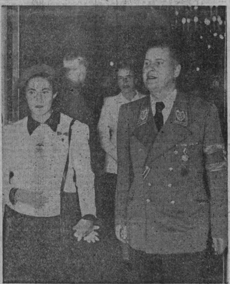
La delegada de la Sección Femenina, Baldur von Schirach, antiguo jefe de las Juventudes y actual gobernador de Viena, en Breslau.

Con verdadera emoción recuerda Pilar Primo de Rivera el viaje que realizó por tierras del Reich hasta el campamento de la División Azul.