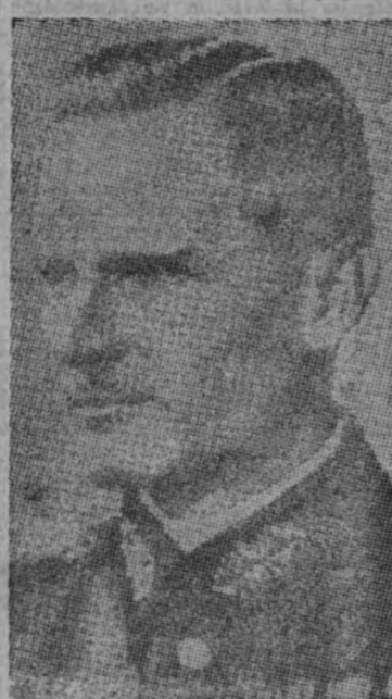
El general von Stupnagel, jefe de las fuerzas alemanas de ocupación en Francia.

PARIS 18.—El general von Stupnagel, jefe de las fuerzas militares alemanas de ocupación, ha dirigido una comunicación a la población, en la que declara que, a pesar de las medidas adoptadas, se han cometido nuevos atentados contra los soldados alemanes. Re-